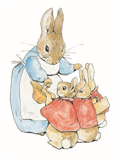
■ 小兔彼得的母親與小福 小毛 和小白