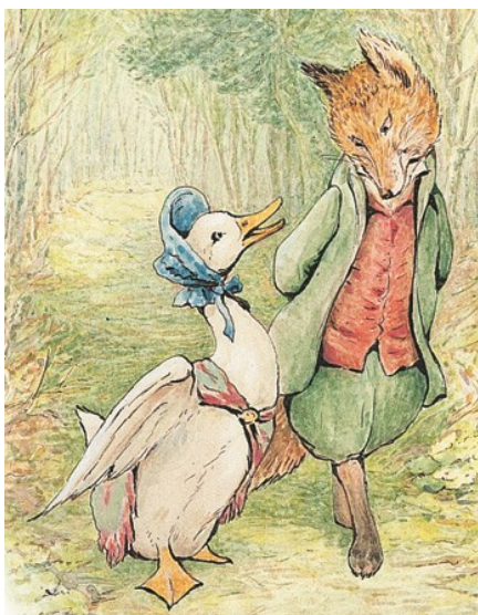
■ 母鴨潔瑪和狐狸紳士