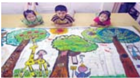
舞鶴國小以「舞動文化符碼——圖騰胚布彩繪」為主題，教導學生圖騰彩繪。

2007 亞太藝術教育國際研討會於10月24至26日在花蓮教育大學舉行，除靜態的專題演講、論文發表、亞洲藝術教育展及亞洲地區教科書聯展外，還有動態的創意工作坊及生態文化藝術等活動，透過理論與教學經驗的交流分享、學術辯證、教學工作坊、成果展演等，探討亞洲地區藝術課程與教學，以改進教學品質，分享學術研究經驗與心得，提升學術研究風氣及藝術教育的研究水準。