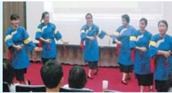
屏東教育大學邀請「藍衫樂舞團」到「台灣客家文史藝術研習營」會場，表演客家傳統舞蹈。

鑑於客家文化在文史、藝術、風俗習慣等方面都有豐富的內涵，為了強化對客家文化的認同，屏東教育大學客家文化研究所在8月舉辦「台灣客家文史藝術研習營」，涵括客家文化、文史藝術等領域，聘請專家學者授課，並配合實務教學，以提升中小學教師規畫鄉土課程的教學能力。