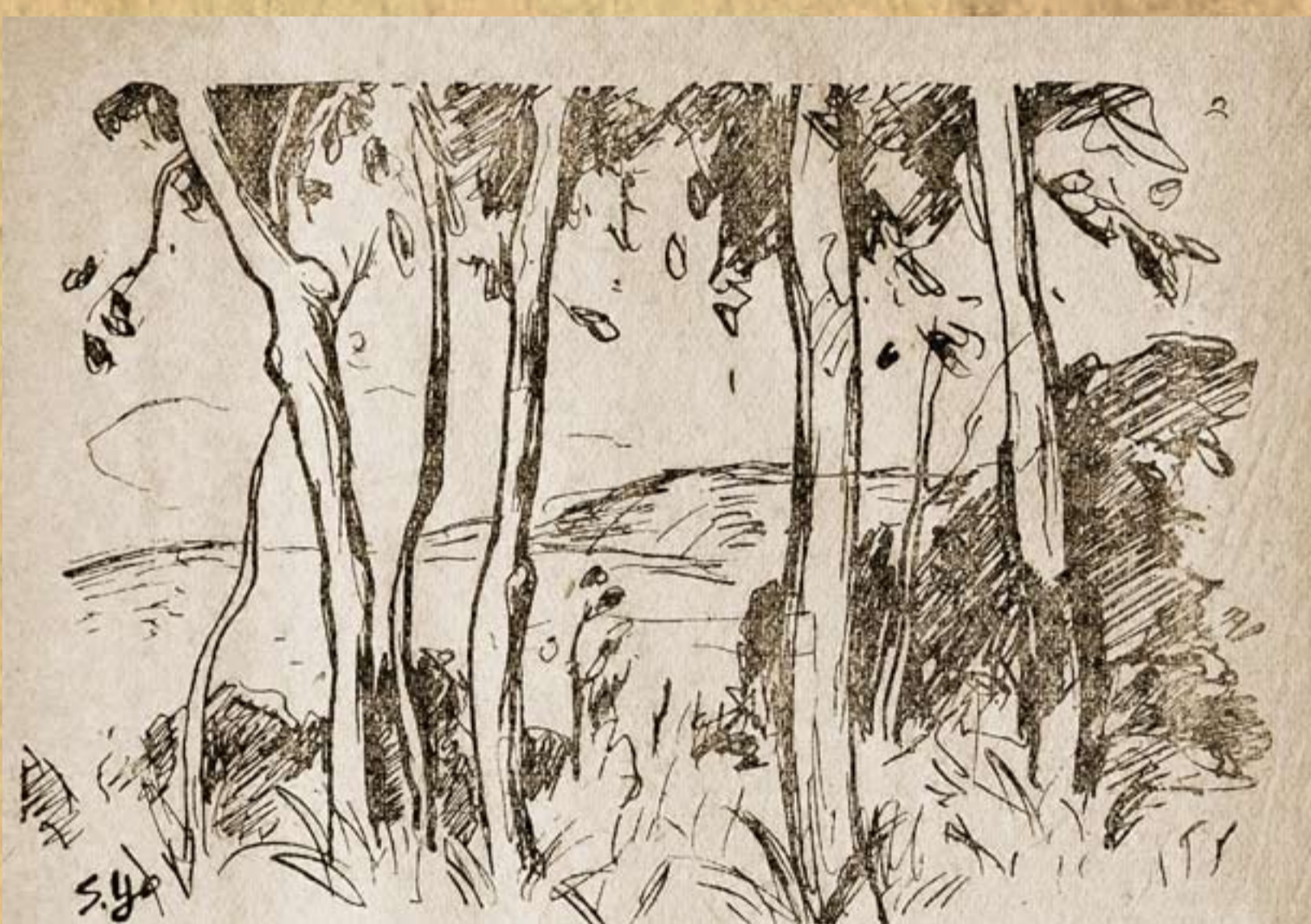
楊三郎繪/《臺灣文學》第2卷第1號