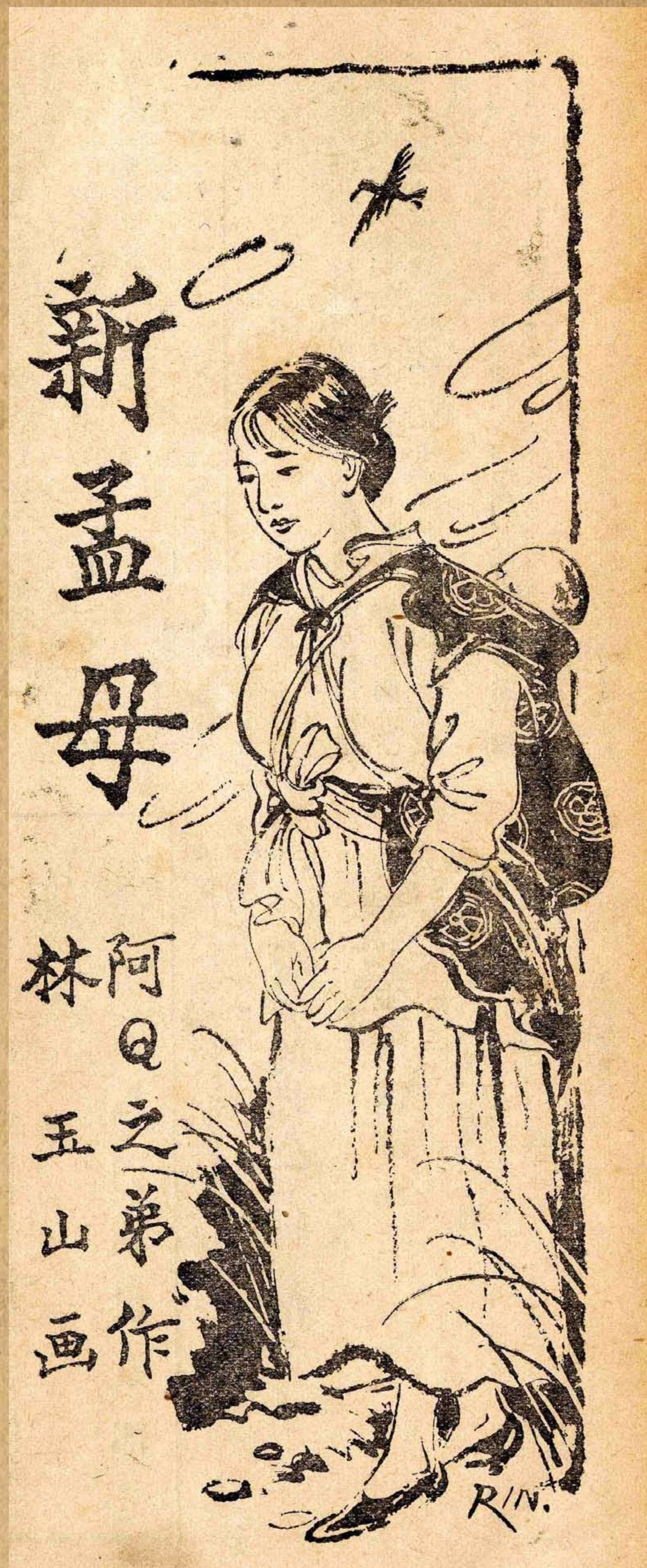
林玉山繪/阿Q之弟著〈新孟母〉(一)/《風月報》