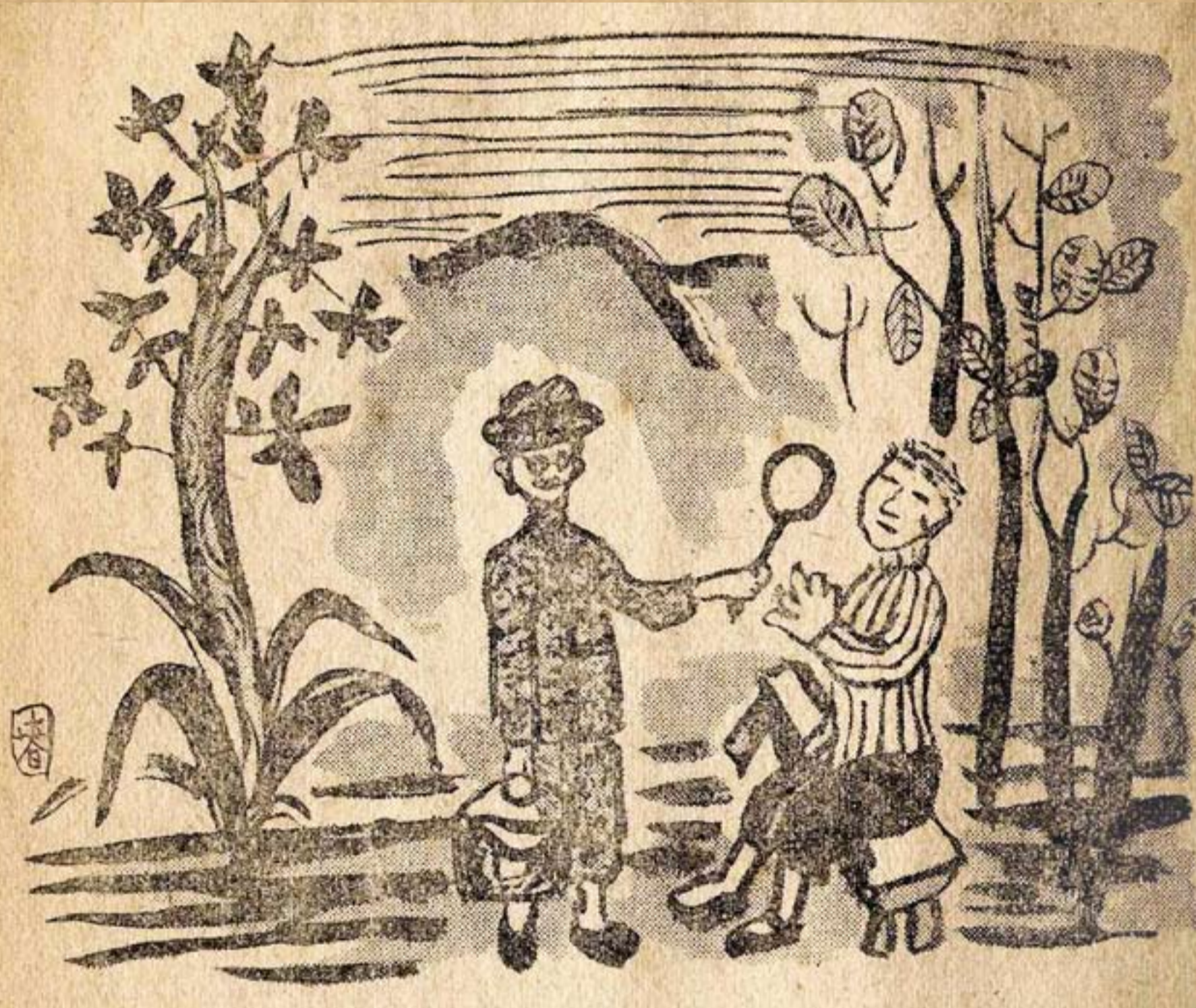
陳春德繪 /《臺灣文學》第2卷第2號