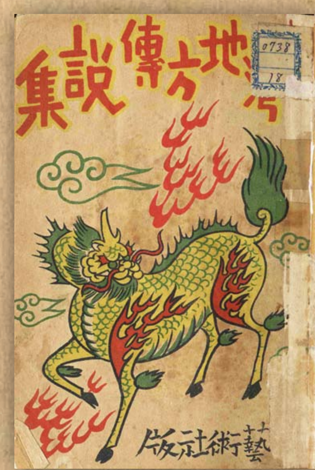
《臺灣地方傳說》封面(紙裝)