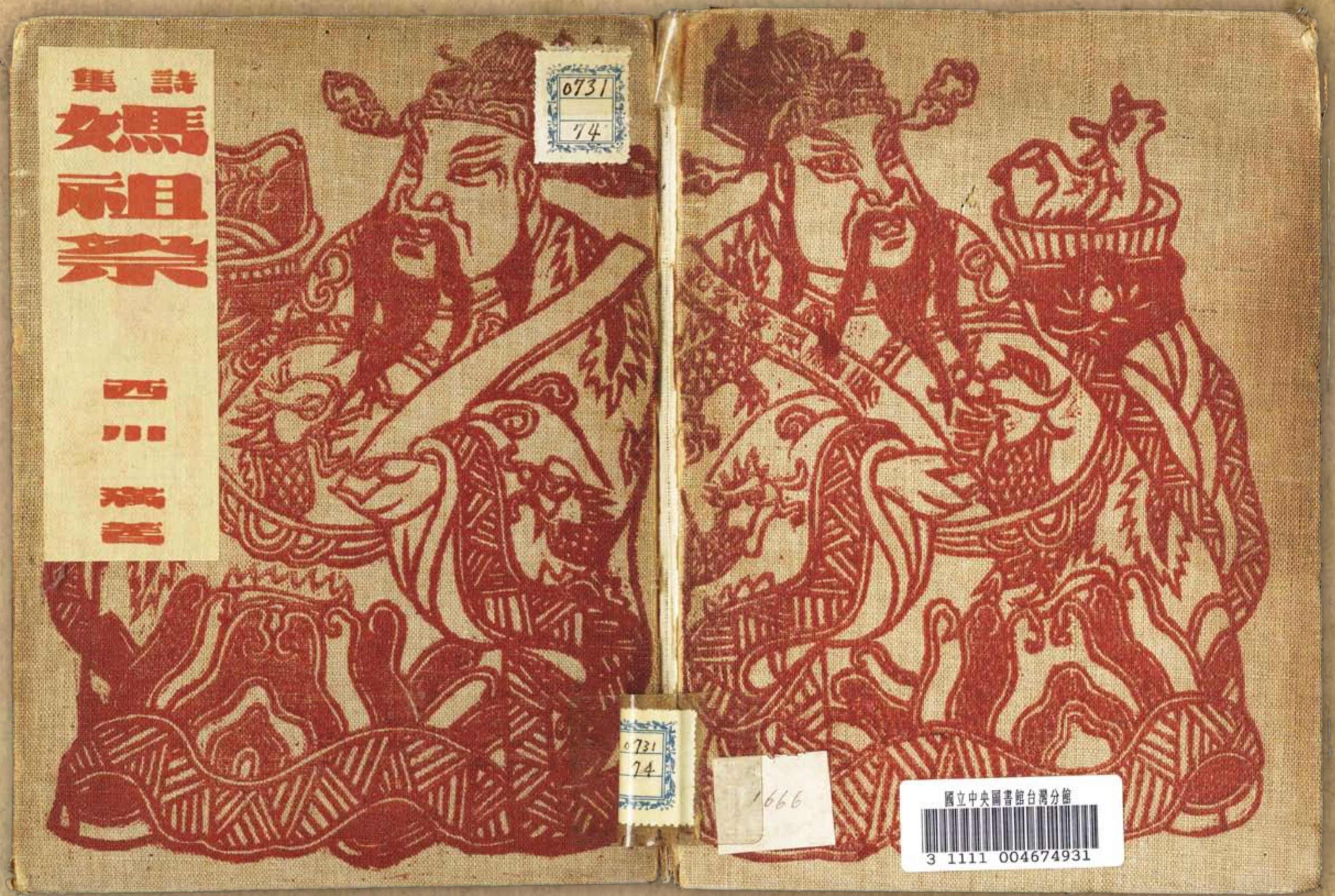
《詩集媽祖祭》封面(布裝)