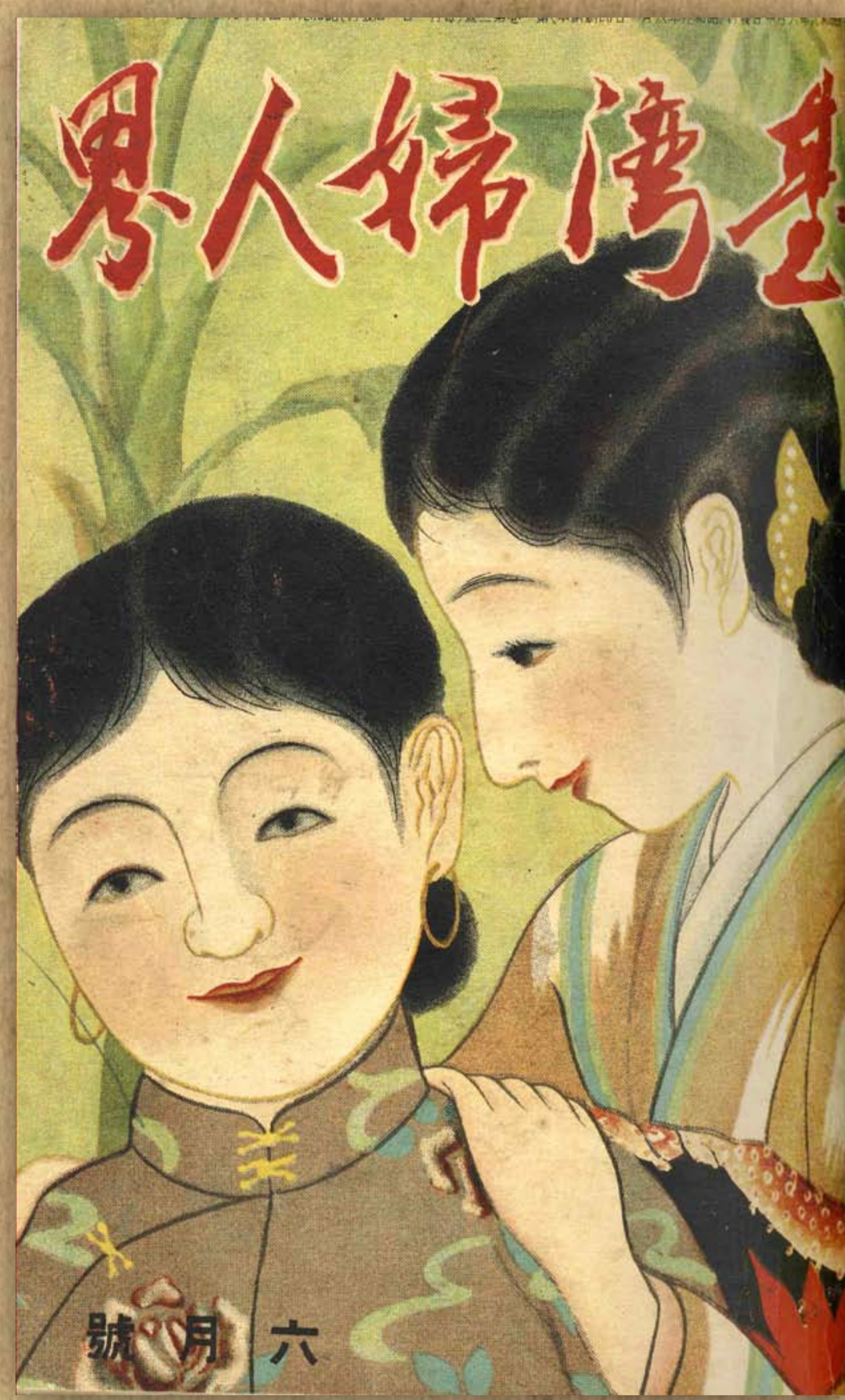
《臺灣婦人界》封面/賈田成峰繪 /《臺灣婦人界》