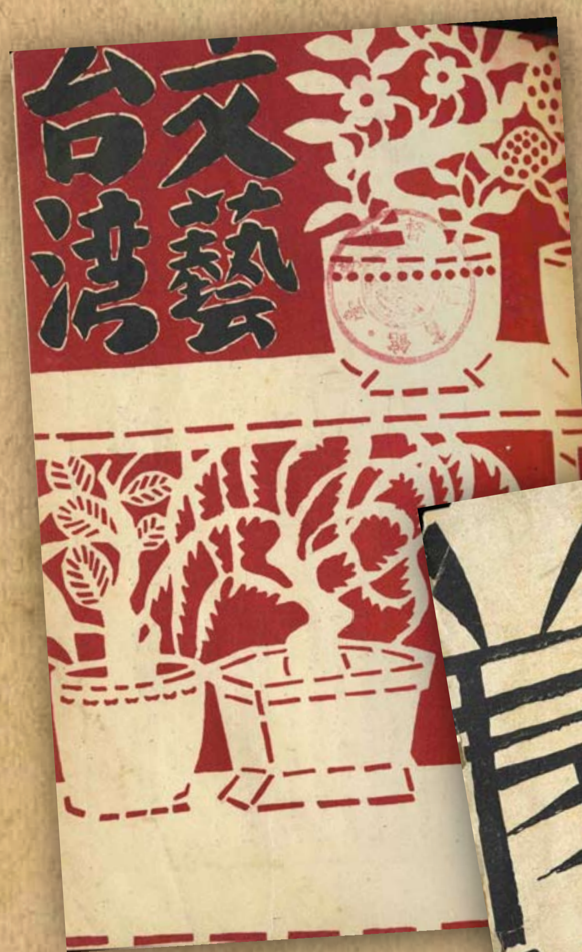
《文藝臺灣》封面/ /《文藝臺灣》第二卷第二號

日治時期臺灣創辦的雜誌有四百多種，依其性質大致上可分為文藝類、學術教育類、財經類、法政類及其他類。學術性質或專業屬性的刊物封面，大多以刊物名稱做簡單的文字排列；而一些文藝性或較為大眾化的雜誌，封面設計的表現則較為活潑且多樣化。表現形式有水彩、油畫、水墨、版畫及攝影等；封面的設計主題則包括具有臺灣特色的動植物、建築景觀、自然風光、風俗民情、原住民主題等。