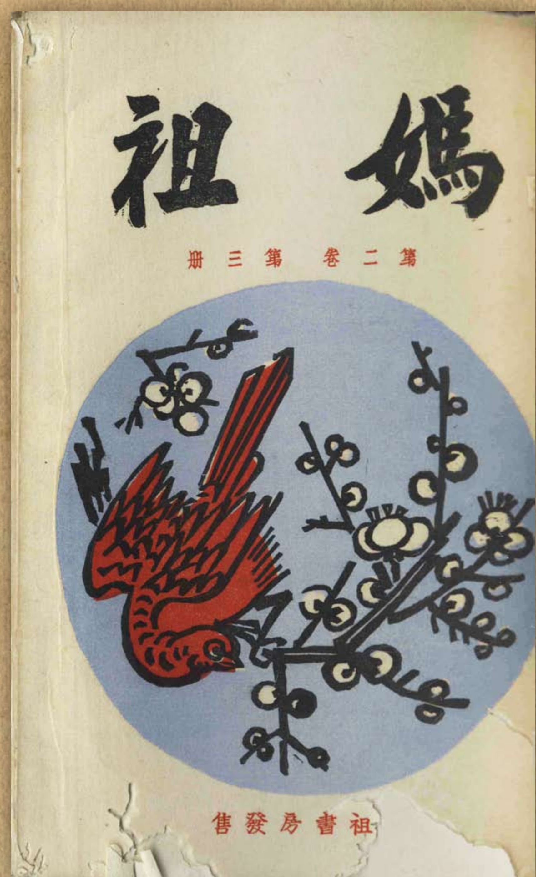
《媽祖》封面/立石鐵臣繪 /《媽祖》第二卷第三冊