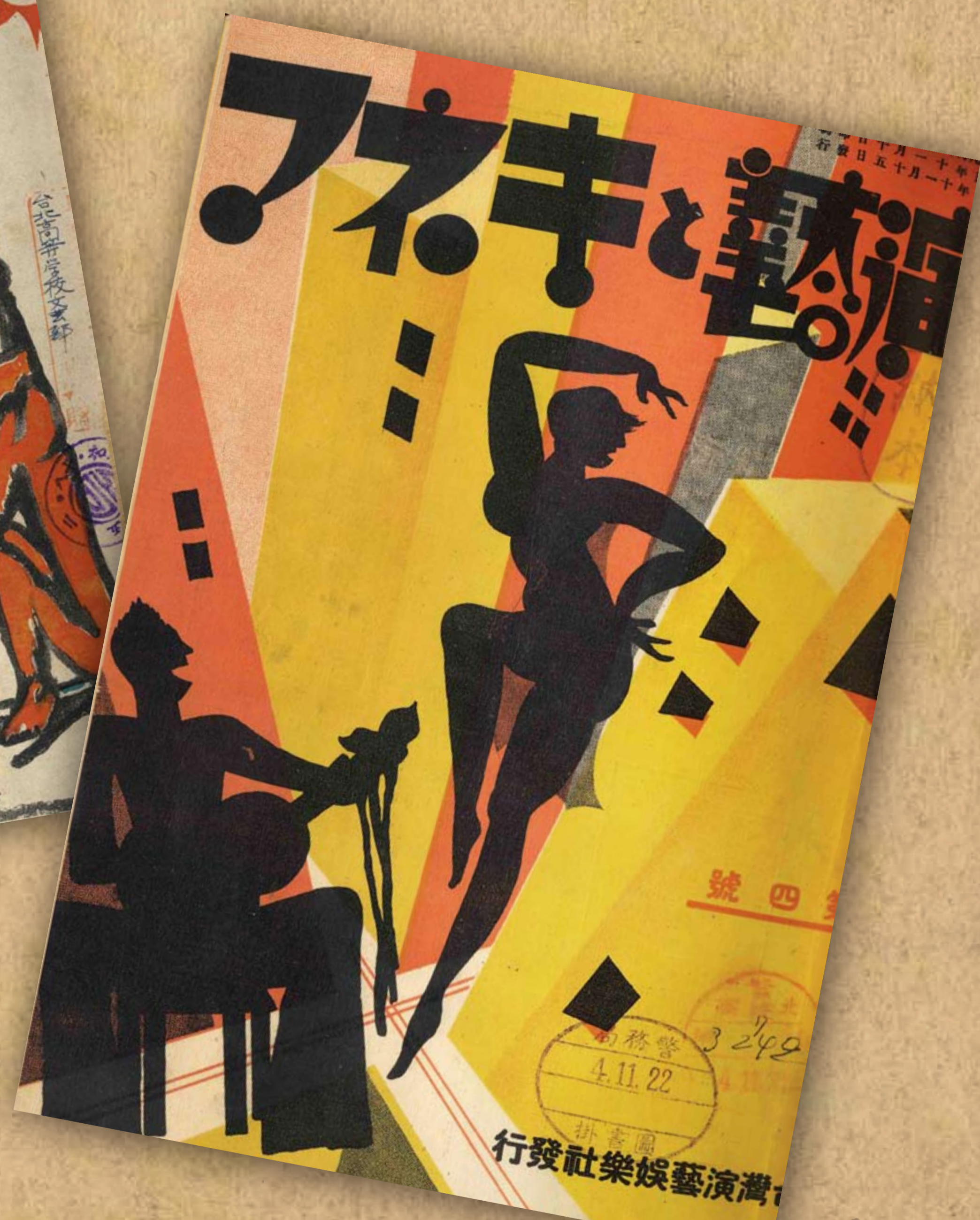
《演藝與電影》封面/城山鈴夢繪 /《演芸とキネマ（演藝與電影）》第四號