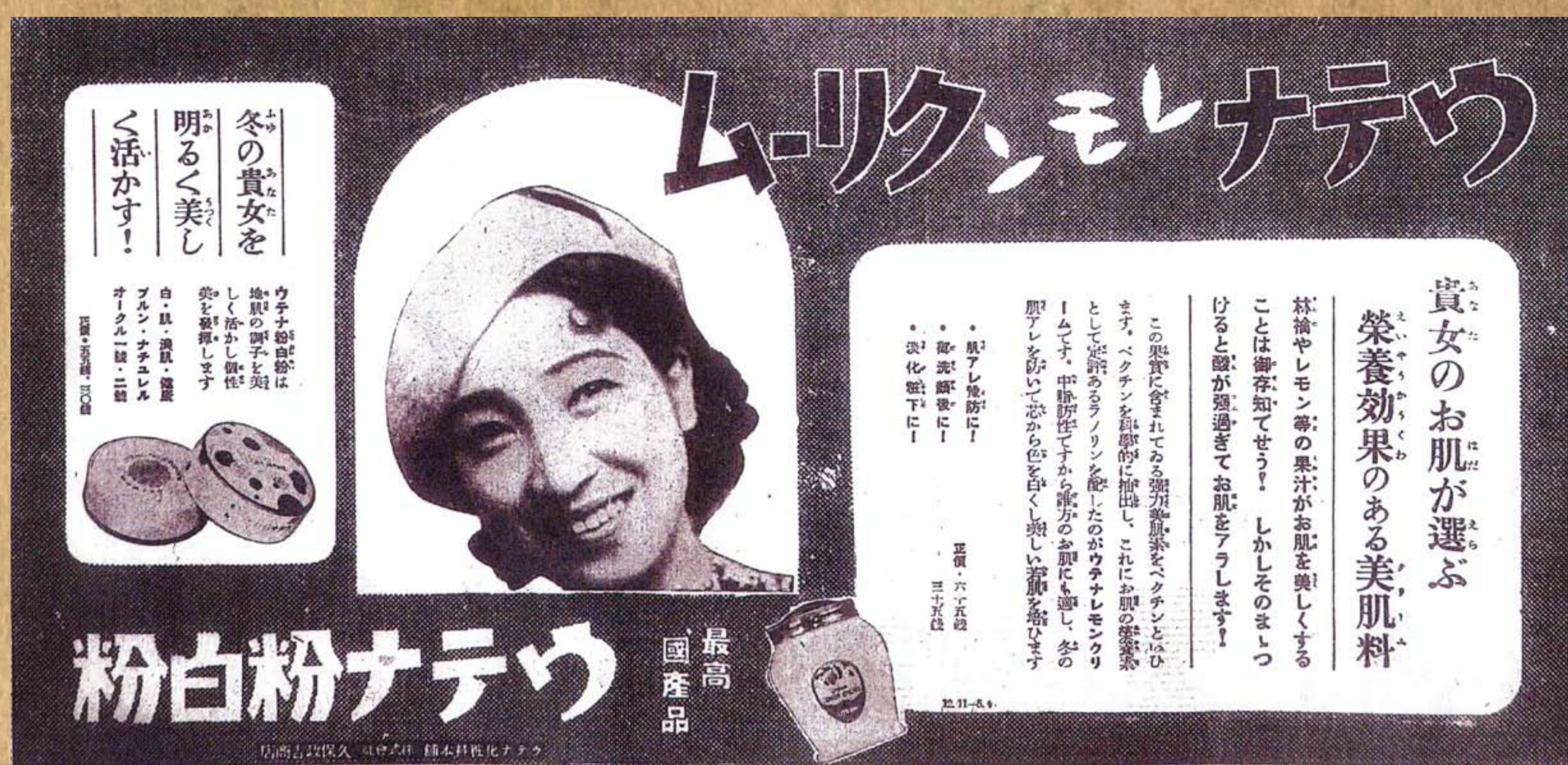
ウテナ粉白粉 / 《臺灣日日新報》

業者透過報紙、畫報、雜誌等平面媒體刊登商業廣告，藉以宣傳及促銷自家商品、商號或商標。日治初期，第一份發行的報紙《臺灣新報》即有不少日本國內企業主刊登的廣告。1898年，《臺灣日日新報》發刊後，藥品、化妝品、圖書、食料品四項，長期佔該報廣告物品版面的大宗。到了1920年代，受歐戰結束，經濟蓬勃發展之影響，報紙的廣告數量穩定成長。1930年代，受到世界經濟大恐慌效應及中日戰局之影響，廣告數量時有增減，呈現不穩定之發展。簡單的說，此一時期的廣告與商業發展、經濟情勢、商品製造、民眾消費習慣息息相關。