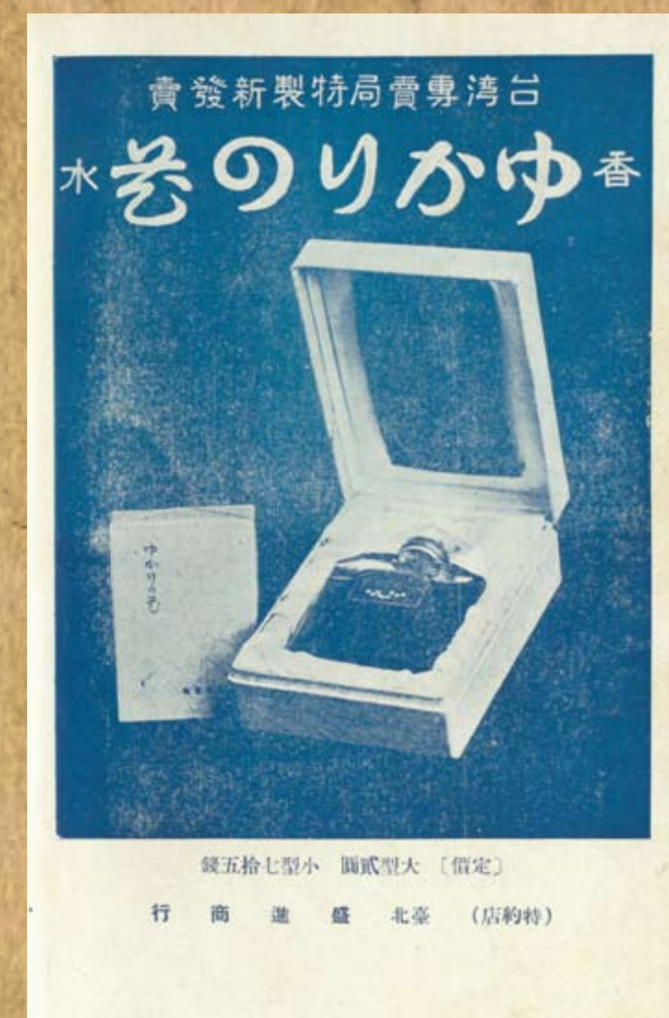
臺灣專賣局製作的香水廣告 / 《臺灣婦人界第一卷》第四期