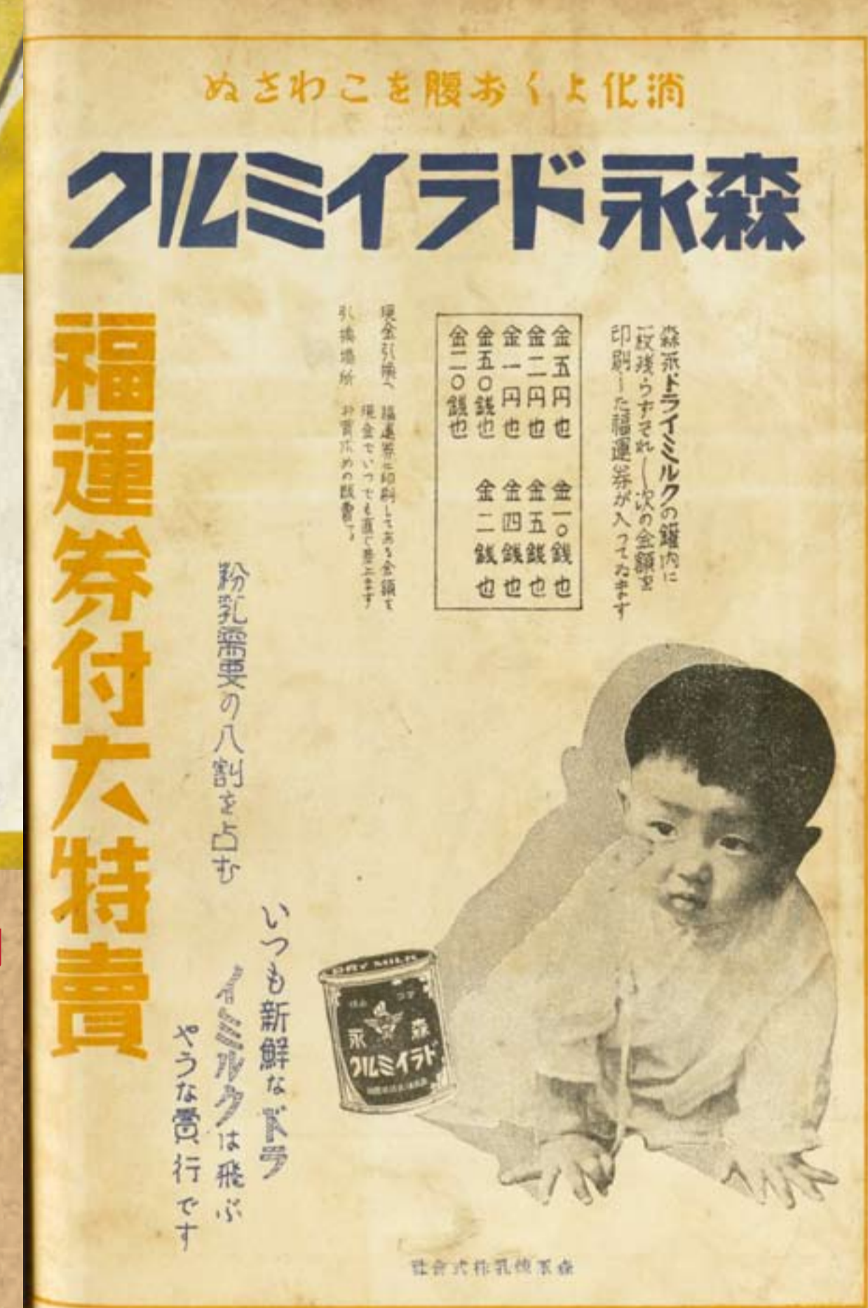
森永煉乳廣告 / 《臺灣婦人界第二卷》第八期