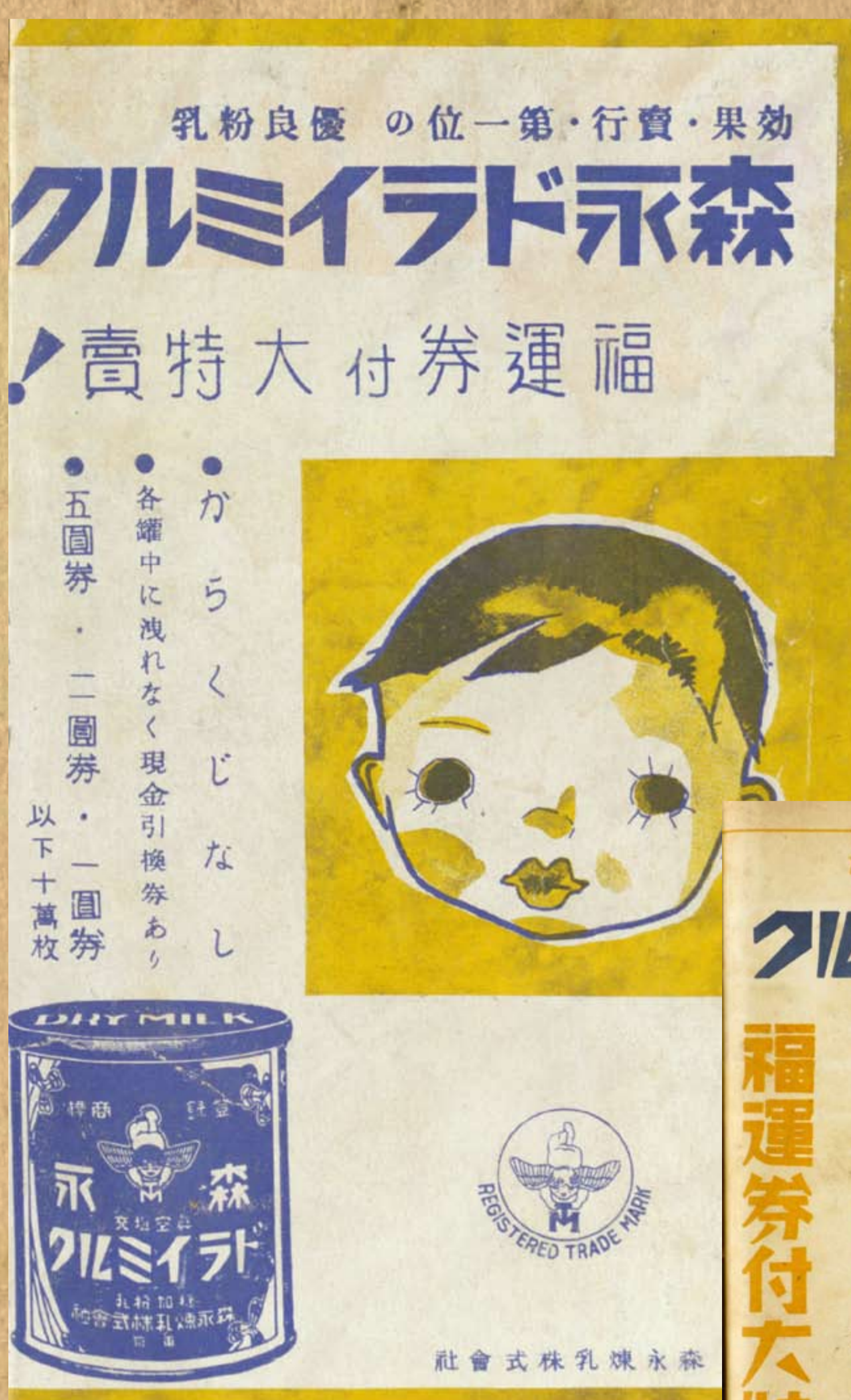
森永煉乳廣告 / 《臺灣婦人界第三卷》第十期