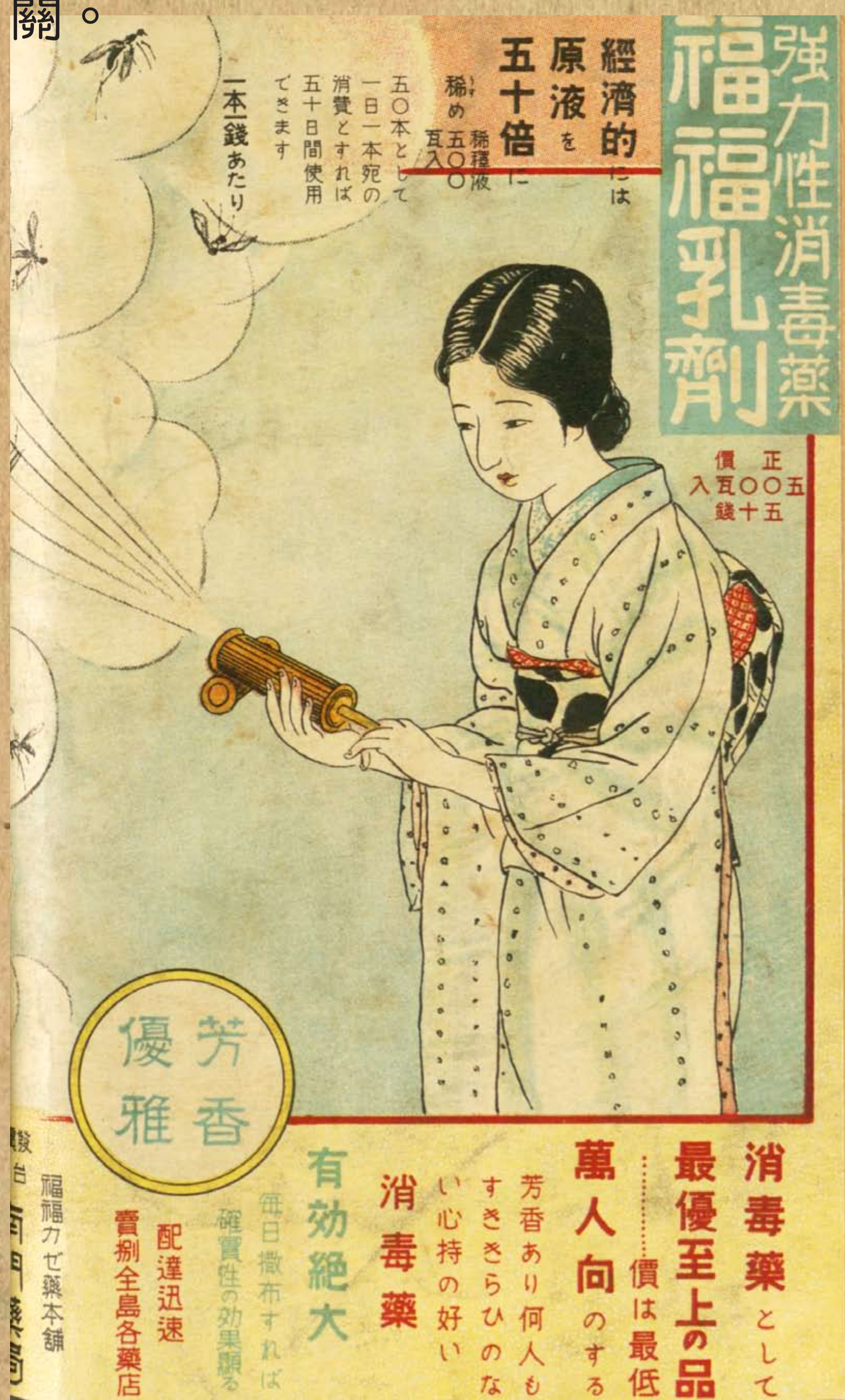
強力消毒藥-福福乳劑廣告 / 《臺灣婦人界第一卷》第二期