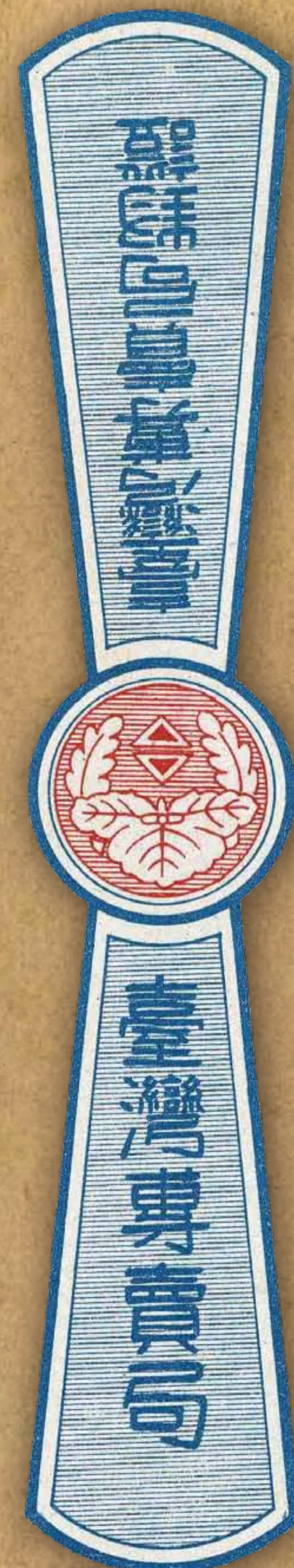
清酒封緘票(1922年4月制定) / 《臺灣酒專賣史》(下)