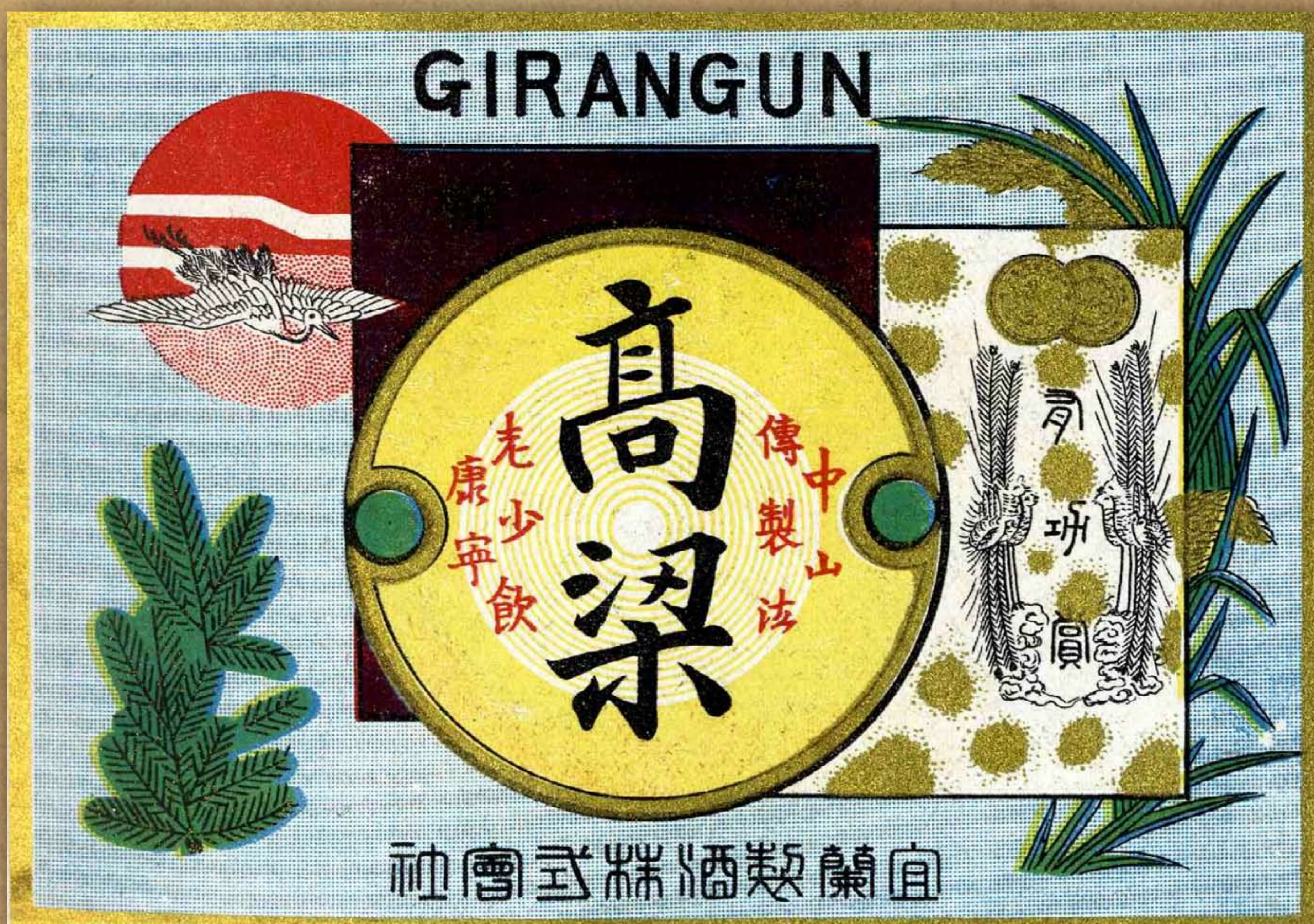
宜蘭製酒會社高粱酒標帖 1910年代 / 《臺灣酒專賣史》(下)