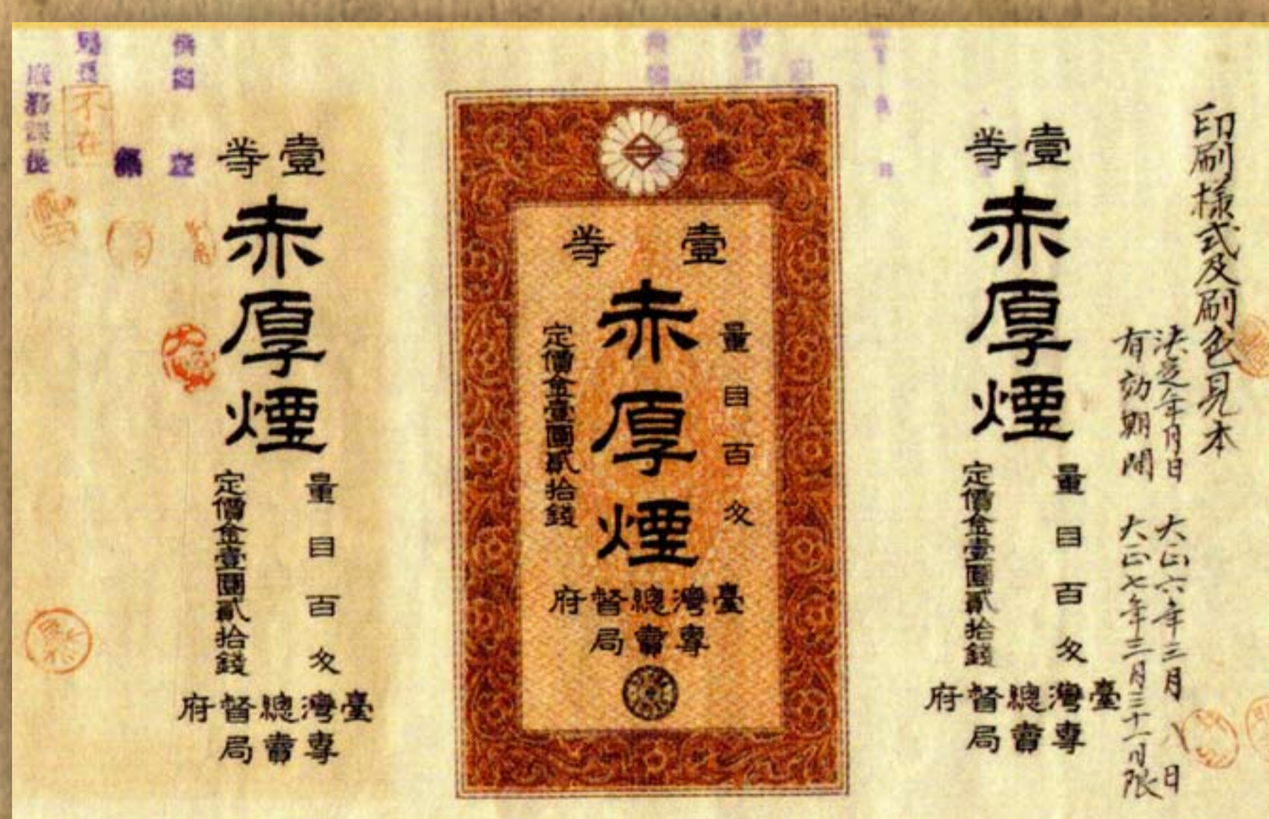
1917年壹等赤厚菸商標 / 《臺灣總督府專賣局公文類纂》