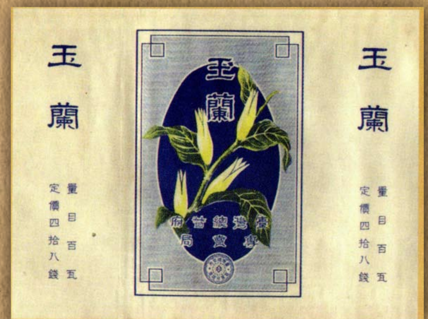
玉蘭菸商標 / 《臺灣總督府專賣局公文類纂》