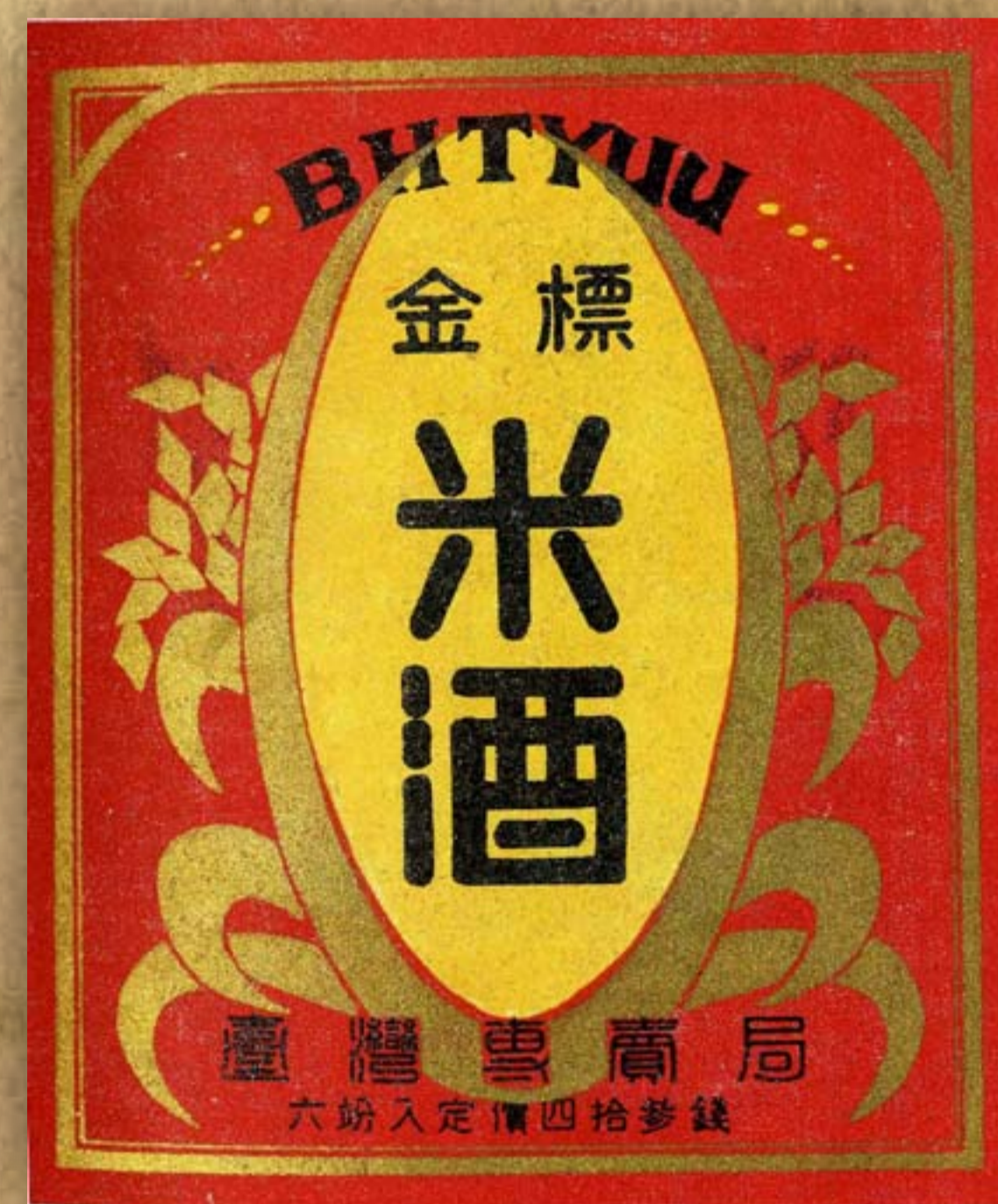
1938年金標米酒 / 《臺灣酒專賣史》(下)