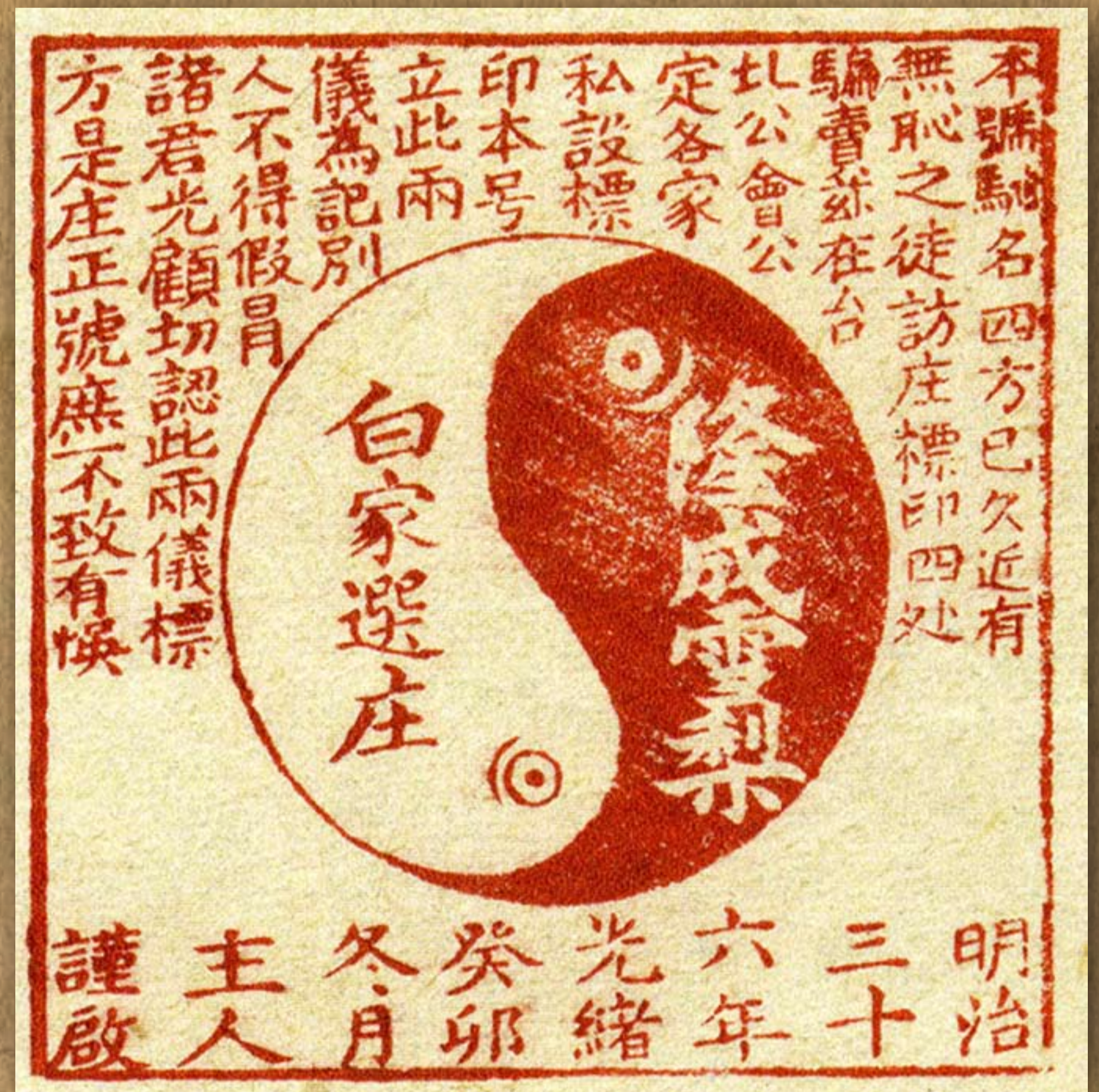
泉美號雙儀茶葉商標 / 《臺灣總督府公文類纂》

臺灣總督府因財政目的，將鴉片、食鹽、樟腦、菸、酒、度量衡、火柴及汽油等列入專賣商品。其中，以菸酒商標種類最多，本館典藏《臺灣酒專賣史》一書中收錄專賣局酒商標，是研究酒商標重要的資料。