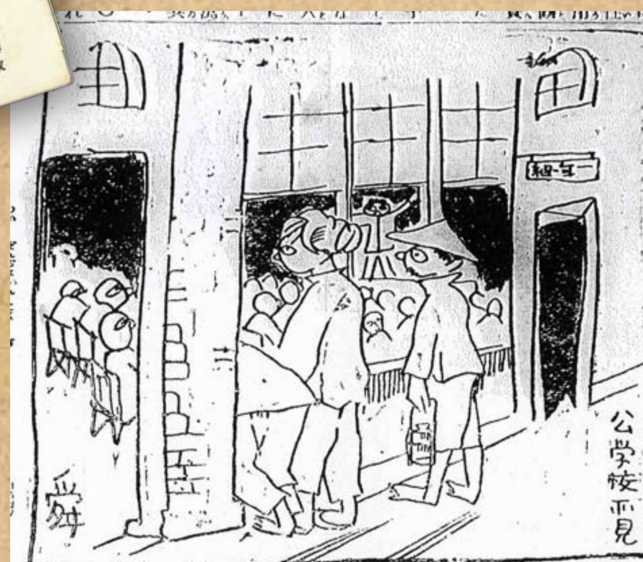
舜吉「公學校所見」(一) ／《臺灣日日新報》