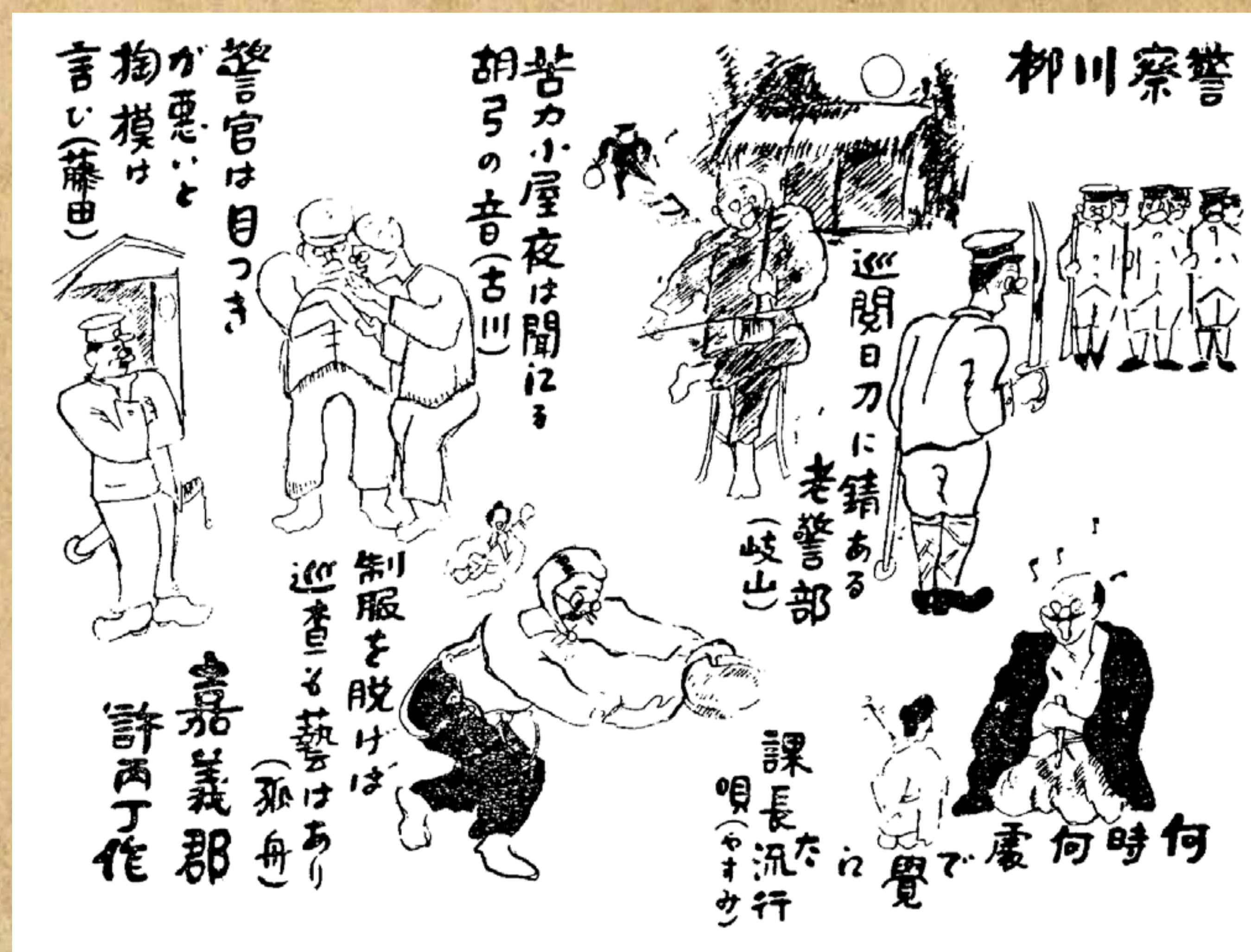
許丙丁繪「警察川柳」／《臺灣警察時報》第6號