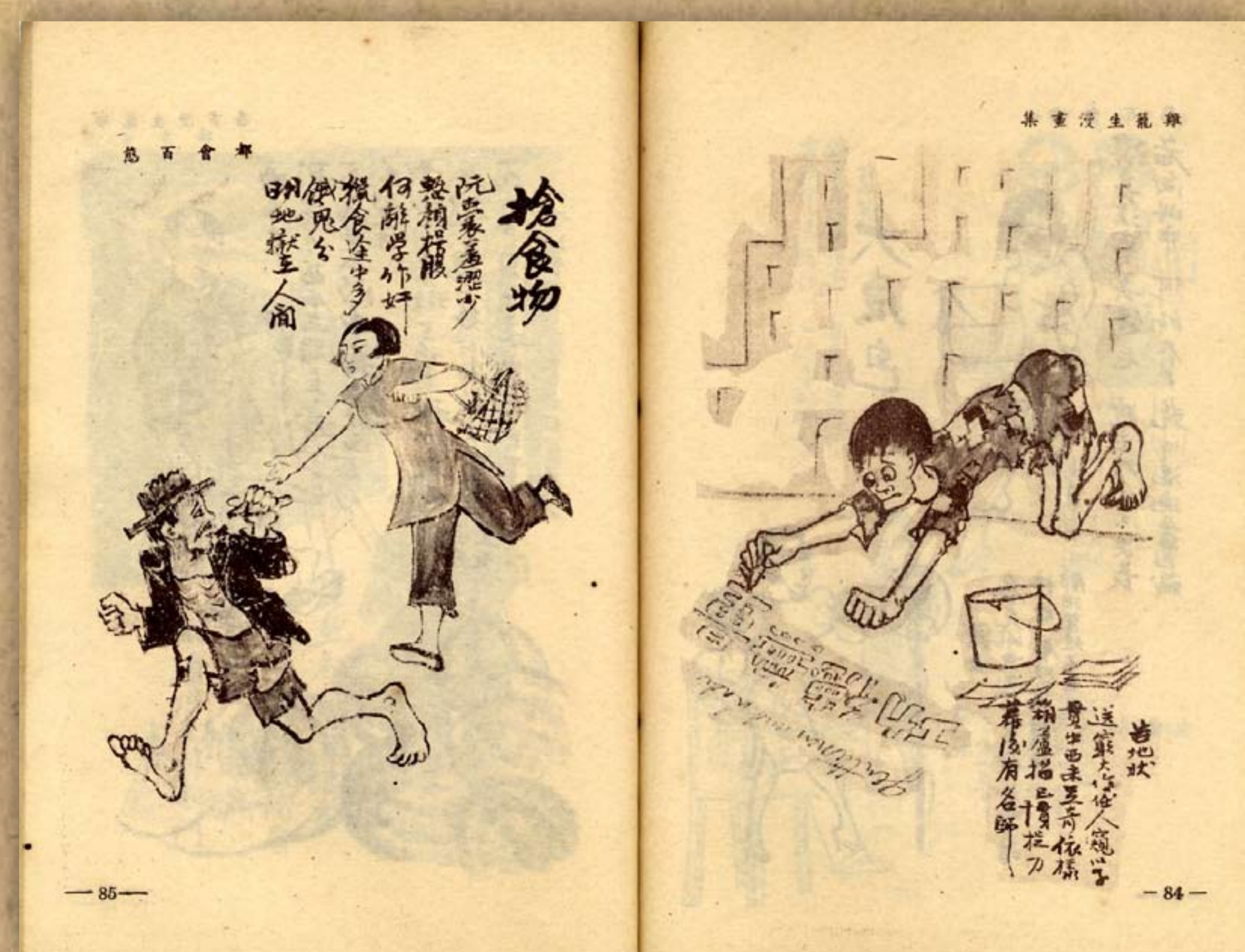
雞籠生戰後作品／《雞籠生漫畫集》第二集