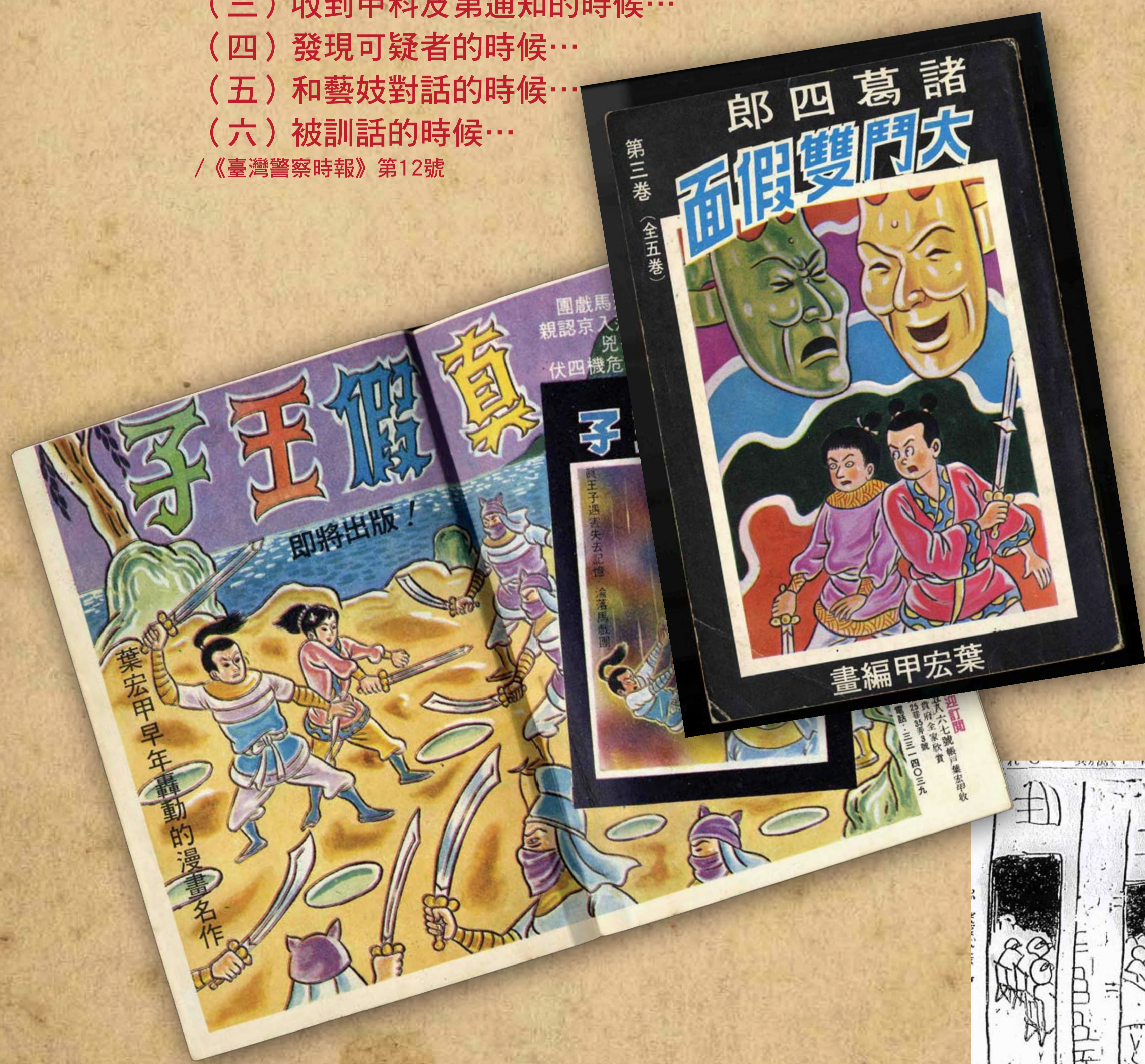
葉宏甲戰後作品／《諸葛四郎》