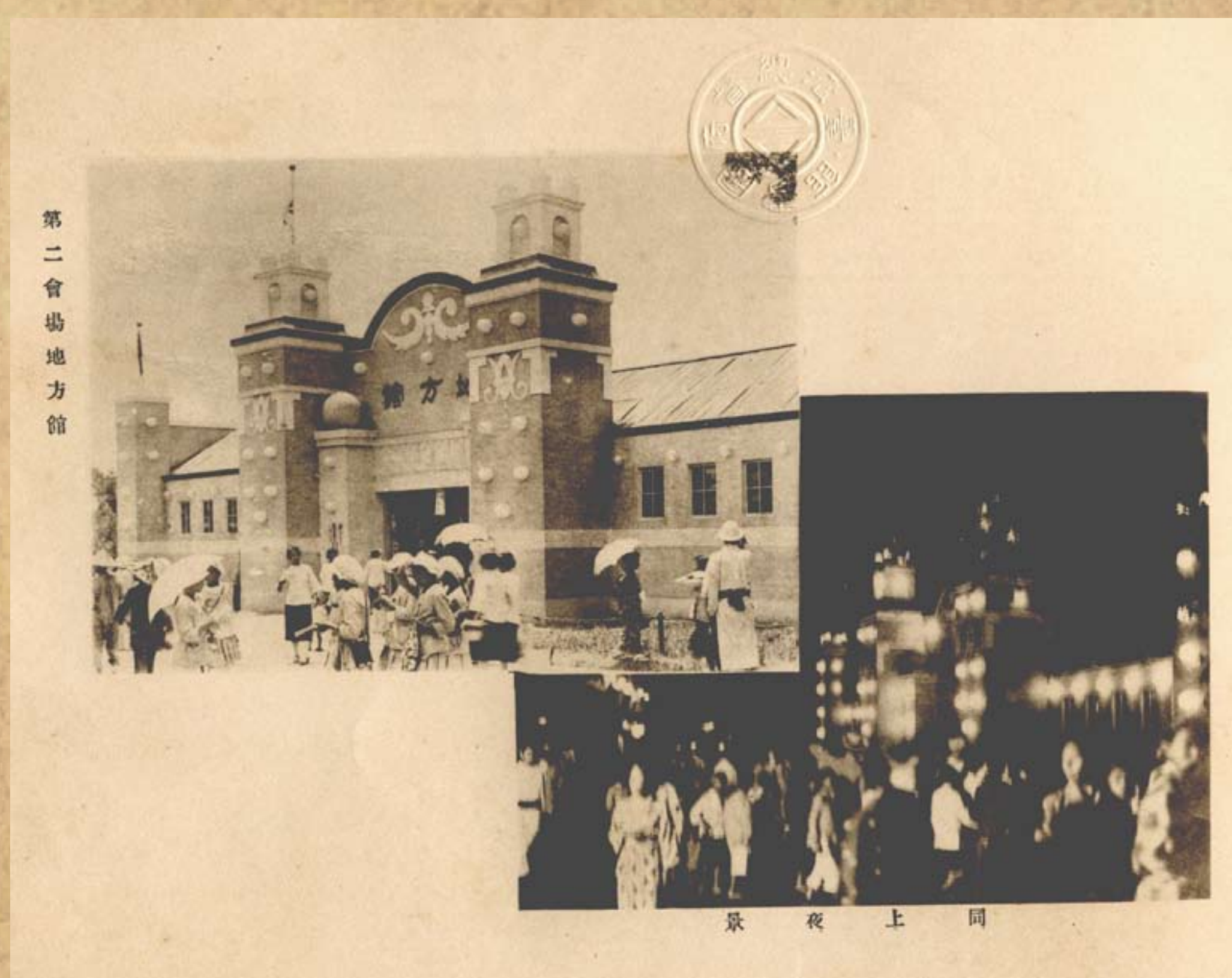
始政三十年紀念博覽會地方館的盛況 / 《始政三十年紀念寫真畫報》