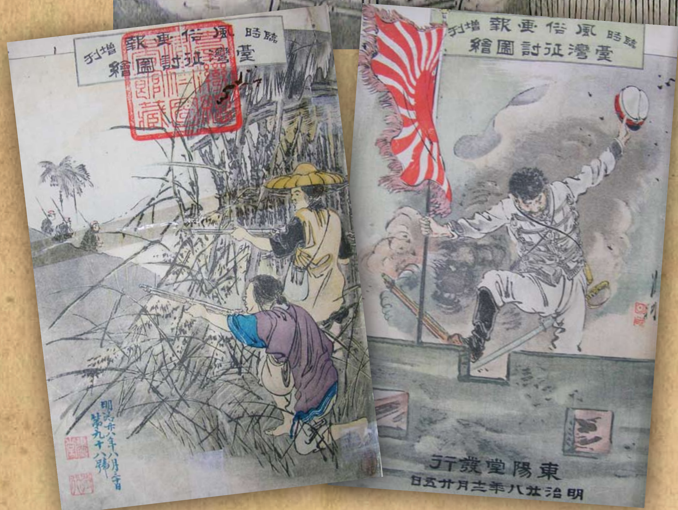
抗日游擊隊襲擊日軍實況 / 《臨時風俗畫報-臺灣征討圖繪》