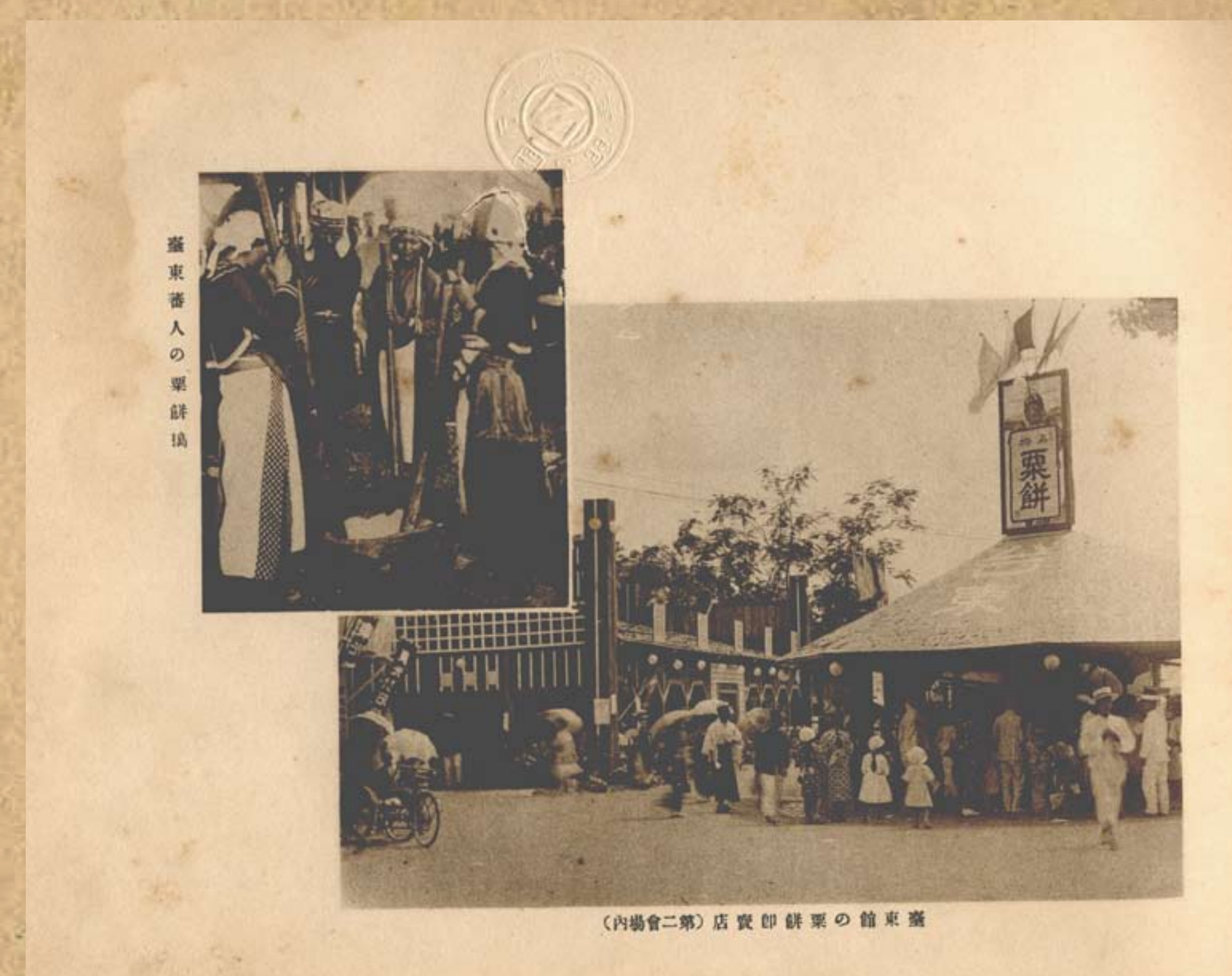
始政三十年紀念博覽會內栗餅製作及販賣實況