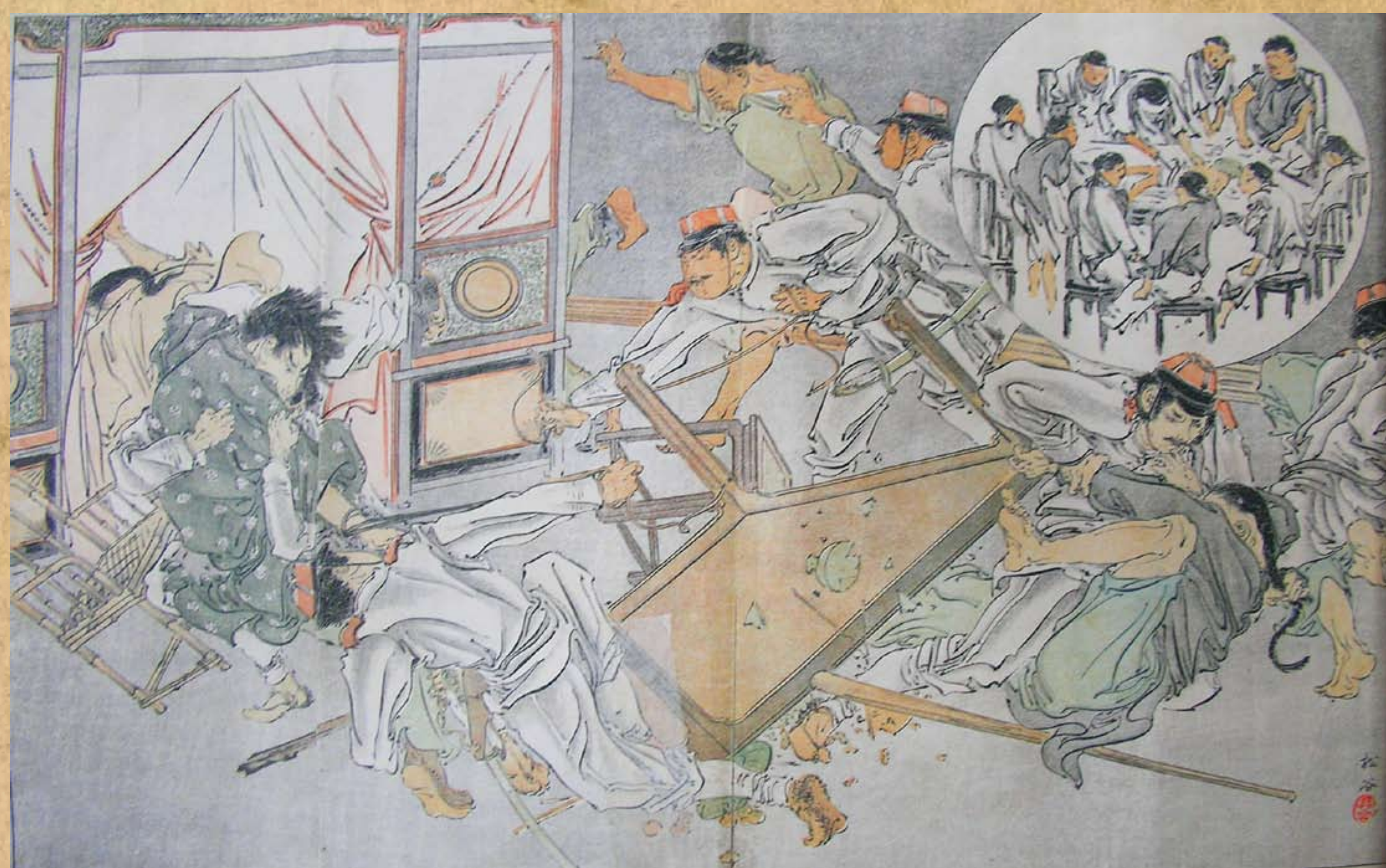
日軍征臺期間緝捕抗日游擊隊實況 / 《臨時風俗畫報-臺灣征討圖繪》

一則介紹臺灣傳統社會，使日本國民得以認識臺灣此一新領土。其後，隨著照相機的普及，寫真畫報陸續出版，別具意義，諸如《始政三十年紀念寫真畫報》、《昭和十年臺灣大震災記念畫報》、《臺灣日日寫真畫報》等。