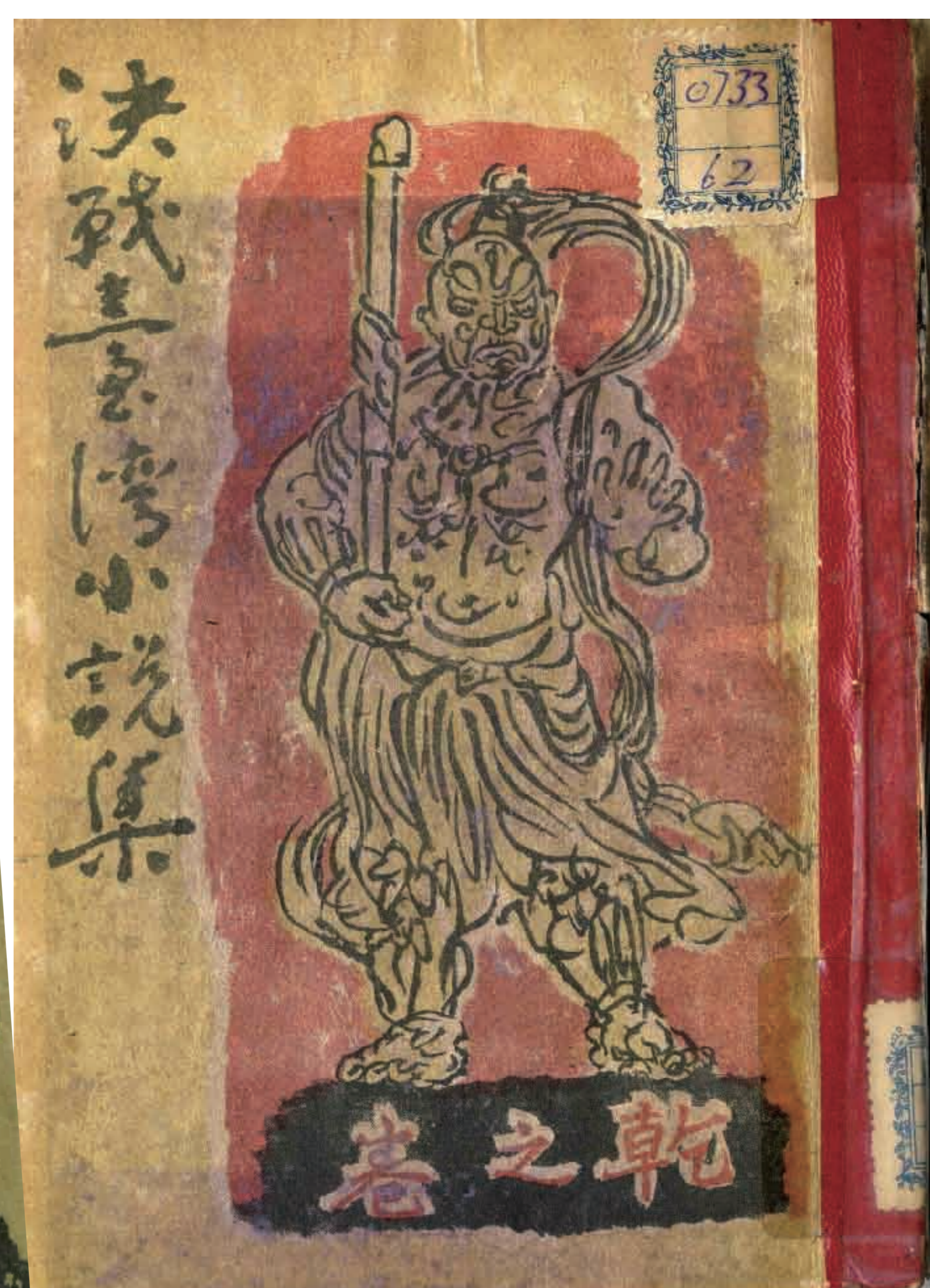
《決戰臺灣小說集》乾之卷、坤之卷