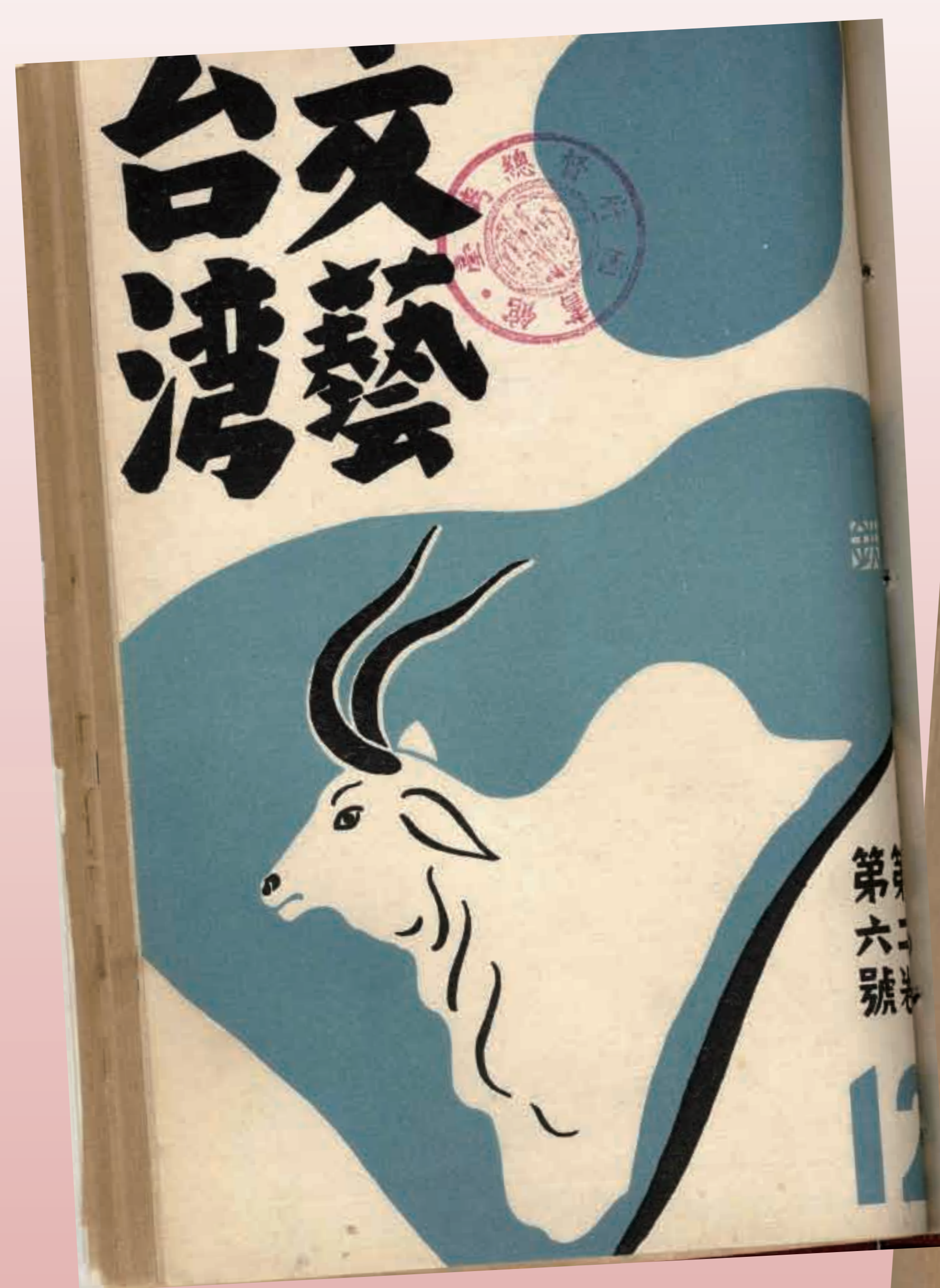
《文藝台灣》第2卷第6號封面