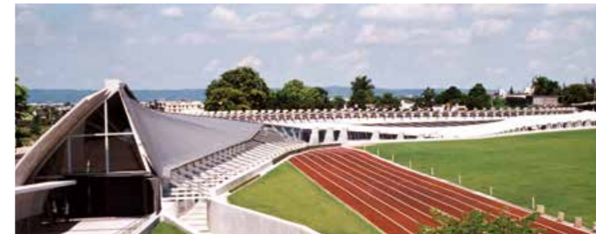
◀▲《九二一震後20年紀事》詳載震後二十年來變化；左圖為位於臺中霧峰的九二一地震教育園區。