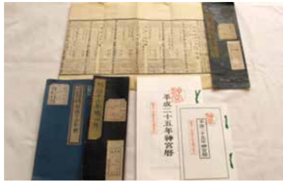
▲神宮曆和伊勢曆。

日本明治政府推行西化，1872年（明治5年）將曆法與西方統一，該年12月3日（舊曆）改為明治6年1月1日（新曆），以利和西方國家接軌與近代化的推行。