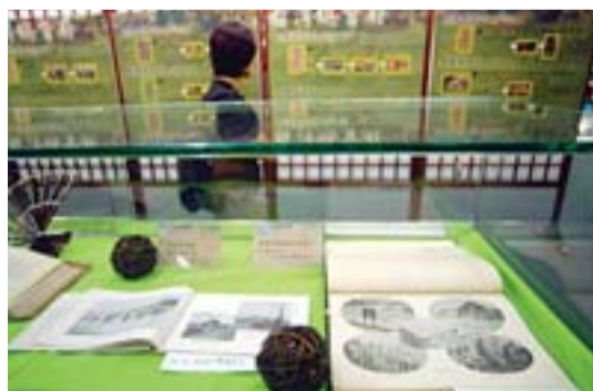
■寫真帖特展歡迎民眾前往參觀。

告」的意涵，藉圖畫呈現台灣的商業、物產及建設狀況。一張官葉往往涵蓋台灣的人文、地理、社會等風貌，內容非常豐富。