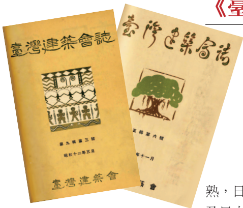
■《臺灣建築會誌》是研究臺灣建築史的參考史料。