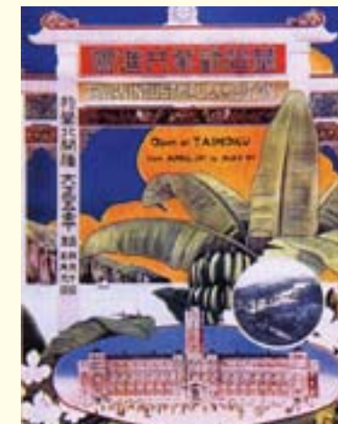
▲臺灣勸業共進會海報。

西元 1932 年的「商業美術展覽會」是以「商業廣告」為主題的展覽，在臺南、高雄、臺中、新竹等地舉辦，展出歐美各國、日本、臺灣各企業的廣告方式。當時在會場中所發表的「發