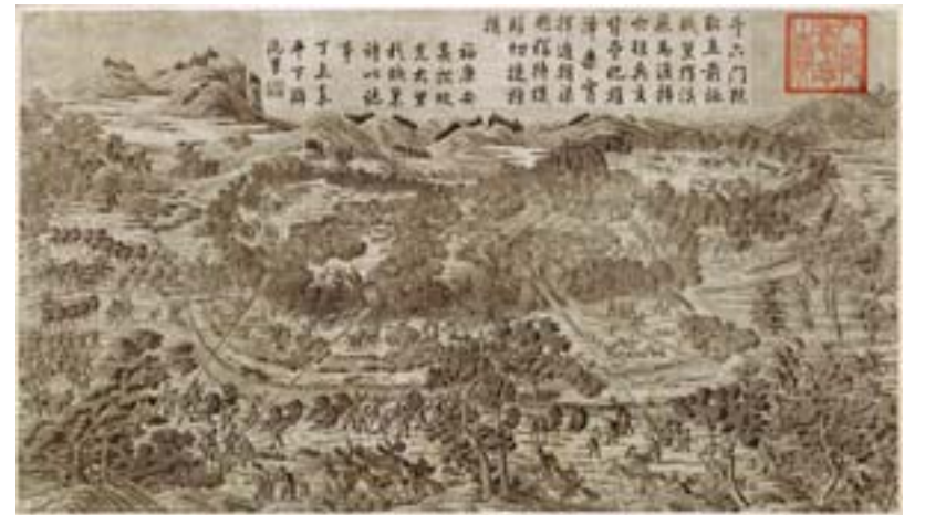
▲福康安奏報大里杙之戰圖。