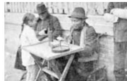
▲日治時期「龜卦」寫真