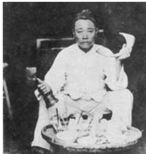
▲日治時期「道士」寫真，左手持「龍角」，右手持「帝鐘」（又稱「三清鈴」），正進行「送外方」之驅鬼儀式。

牛、拾豬屎、拾牛屎等描述較為詳細；於臺灣人的私刑述及也較深入，如盜採甘蔗，就提及：「一枝放汝去，二枝打竹刺，三枝罰一棚戲」的臺灣民間社會「慣習語」。