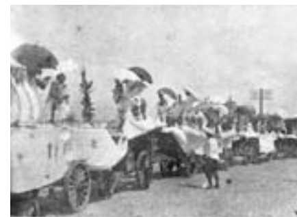
▲日治時期「臺閣」（即「藝閣」）寫真（西岡英夫《臺灣の風俗》，頁 31，東京：雄山閣。）

就民俗內容的呈現而言，《民俗臺灣》較為活潑有趣，民俗寫真、民俗圖繪、民藝解說等呈現了前所未有圖文並茂的特色。而民俗議題如童乩、淨符、化骨符、家畜用符、安胎符等，有的則是初次被呈現出來討論，有的論述比以前更為深刻，媳婦仔、養女等專輯質量都頗有可觀。其他如冬生娘仔、娶神主、俚諺、民談、傳說、戲曲、遊戲、民俗醫療等，亦不乏呈現新民俗議題者。