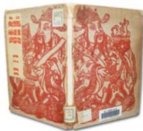
▲西川滿詩集《媽祖祭》的書影。

例如，小林里平曾編輯《臺灣慣習記事》，擔任舊慣調查會囑託、法院書記等職，通曉中文與臺語，其《臺灣歲時記》說明四季的人事、動物及植物。又如，片岡巖擔任法院通譯，其《臺灣風俗誌》被時論選為認識臺灣最佳的參考書之一。鈴木清一郎任職警務局，其《臺灣舊