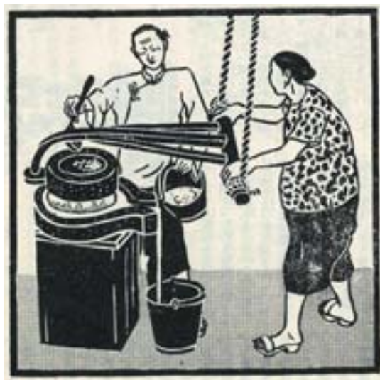
▲挨糶，出自《民俗臺灣》。

展出日期：即日起至3月29日 展出地點：國立中央圖書館臺灣分館六樓 洽詢電話：(02) 29266888 轉 5414 推廣組