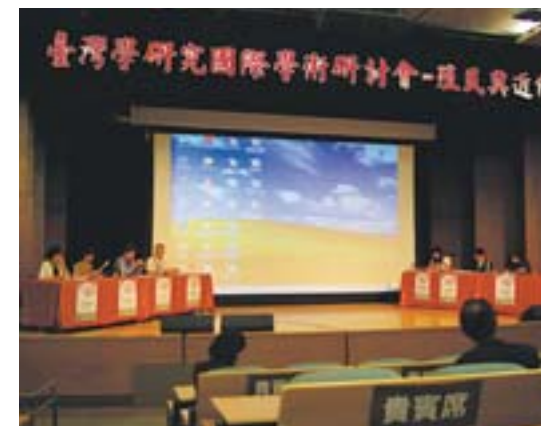
▲舉辦臺灣學相關學術研討會。

臺灣分館歷史悠久，孕育出好幾代的臺灣學研究者：前輩級的學者專家，在舊館時代即勤於耕耘臺灣學園地，欣見分館的蛻變求新；有的研究者在求學階段，見證了分館以全新姿態再出發的轉型過程；新生代的研究者則是在優美的環境中展開臺灣學之旅。無論是學術傳承或教學創新，在專業的領域中，分館扮演的角色有目共睹，成績難能可貴。如上所述，分館是所有參與臺灣學的人共同的家，也是一座臺灣史學教育庫。