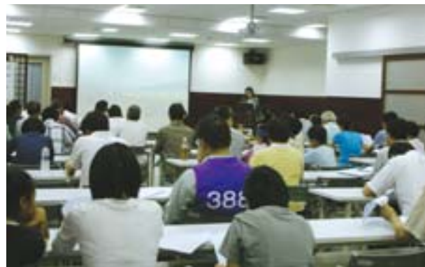
▲為推廣臺灣學知識，每月舉辦專題講座。

臺灣學研究中心為推廣臺灣學知識，每月邀請學者、專家舉辦專題演講，深獲各界好評，並出版成《臺灣學系列講座專輯》一書。同時，每月刊行《臺灣學通訊》，報導臺灣學研究書展、介紹珍貴館藏、臺灣人物誌、臺灣圖書館的故事、在世界遇見臺灣學等，內容多彩多姿。讀者可訂閱分館的電子