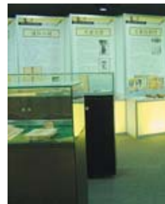
▲為突顯館藏書刊之價值，分館定期策畫主題書展。

另一方面，全國各地的學校教師也可以主動參與臺灣學的建構，舉凡提供訊息、交流互動，