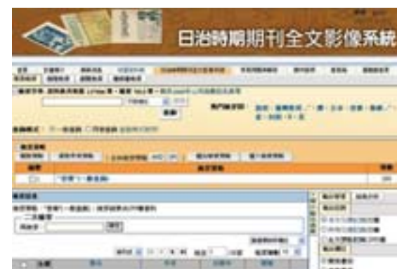
▲日治時期期刊全文影像系統收錄約13萬筆資料。