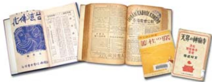
▲《臺灣佛化》、《臺灣教會公報》、《蕃社の曙》、《天昇の神廟寺》。

展出時間：即日起至 10 月 11 日 展出地點：央圖臺灣分館六樓 洽詢電話：(02) 29266888 轉推廣組