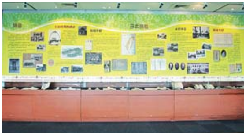
▲重新規劃後的書展專區。