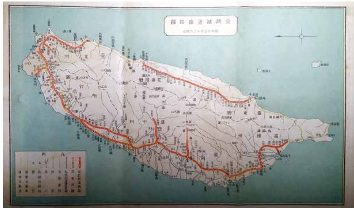
▲ 1940年〈臺灣鐵道線路圖〉。