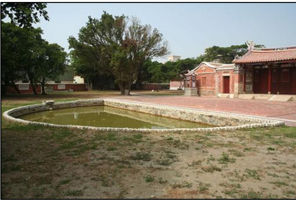
例（一） 屋前水池 半月池