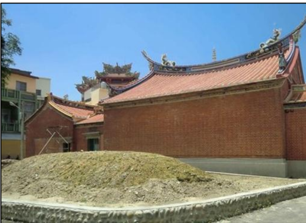
例（二） 屋後土丘 化胎