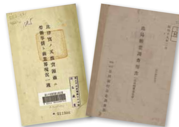
▲《比律賓ノ天然資源並ニ労働事情ト商業界現況一斑》。