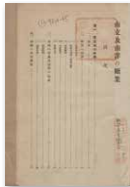
▶《南支及南洋の糖業》目次頁。

業發展歷史與當前情形；關於南洋的部分，則對菲律賓、法屬印度支那、暹羅、爪哇等地進行調查。本文囿於篇幅限制，僅介紹南洋糖業生產最具規模的菲律賓與爪哇。