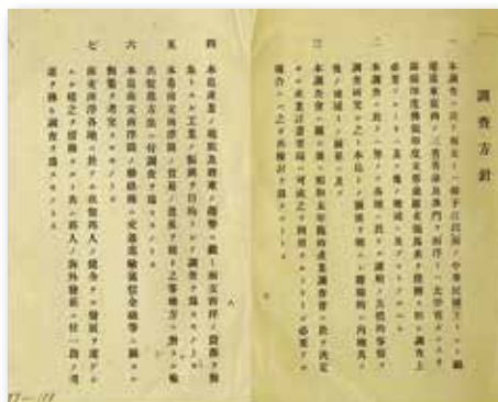
▲熱帶產業調查會調查方針。