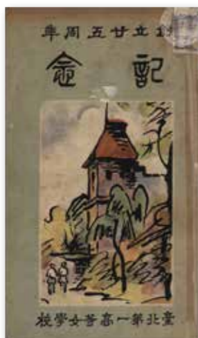
▲圖1 《臺北第一高等女學校創立二十五周年紀念》。

臺灣總督府於1896至1898年間，陸續在臺北、基隆、宜蘭、臺中等地設立「國語傳習所」，設立之初便是以同時招收男女學生為目標。1897年設立「國語學校第一附屬學校女子分教場」（後改稱為「臺北市立中山女子高級中學」），在新式教育制度的建立下，女子教育正式納入正規教育體制的一環。