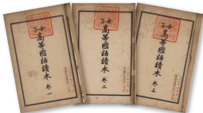
▲圖2 《女子高等國語讀本》卷一～三。

國立臺灣圖書館亦典藏有各女學校自行編輯出版的創校沿革、校友名簿。從《臺灣公立臺北女子高等普通學校一覽》、《臺北州立臺北第一高等女學校要覽》、《臺北州立臺北第二高等女學校一覽》、《臺北州立臺北第三高等女學校一覽》、《臺中州立彰化高等女學校一覽表》、《臺南州立臺南第二高等女學校一覽