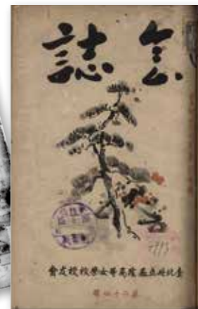
▲圖4 臺北州立基隆高等女學校校友《會誌》。

最後，還值得一提是女學校的刊物，如：臺北第三高等女學校學友會同窗會《扶桑》、基隆高等女學校《會誌》、臺南第二高等女學校校友會《豐榮》、高雄淑德女學校校友會《たちばな》、高雄高等女學校同窗會《雁が音》、花蓮港高等女學校校友會《黑潮》、臺中家政學校校友會《校報》等，這些刊物以學友會或校友會名義出版，內容刊載師長文章、學生參與校內外講習會等活動報導、學生作品等。逢戰爭時期，內容也涉及愛國思想、戰時體制下的教育方針、女子奉公等議題。