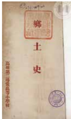
▲圖1：高雄第二尋常高等小學校《鄉土史》封面。

應立足鄉土，強調透過鄉土史與國史的連結，使歷史科教學更為生活化。其二是地理科教學的同心圓理論，強調國土是大鄉土，居住地是小鄉土，教學可由近及遠。