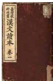
▲《臺灣教科用書漢文讀本》。

1895年日本領臺後，以改造、同化臺灣本島人為終極目標，表現在教育政策上的就是普及國語（日語）。從登臺那年就設立的「芝山巖學堂」起，到其後的「國語傳習所」，乃至專收臺灣人子弟的「公學校」，都是以傳授日語為第一目的。