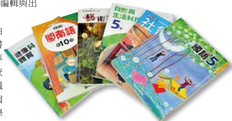
▲教科書全面開放由民間編輯後，編輯與出版開始進入自由市場的時代。

在「88課程標準」中，臺灣史首次成為獨立單元，但仍附屬於中國史下。1997年，教育部推出國中《認識臺灣》教材，分為社會、歷史、地理三冊，首次將臺灣史地整合成單一課程。但是，這項變化也受到部分大中國意識學者的反對，他們甚