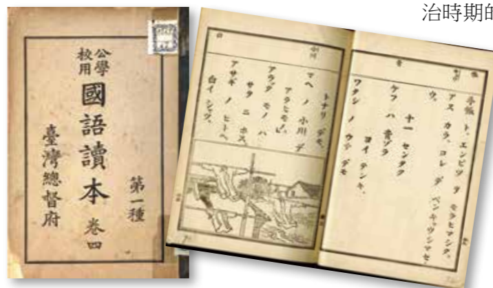
▲《公學校用國語讀本》（左）；「國語」教科書〈洗衣服〉一課教導衛生觀念（右）。

日治時期公學校所編輯、使用的教科書，皆由臺灣總督府統一編纂發行，修身、國語、算術、唱歌與體操等科目，都是以現代化的教育觀念編成，與日本統治以前，著重在背誦、強調科舉考試的書院或書房教育不同。現代化教育除了書本上的學習，也有身體的運動，體操科的實施，便是與傳統書房教育最明顯的差異。然而，臺灣總督府在臺灣所實施的現代化教育，更重要的目的是要涵養國民性格，這裡的「國民」指的是日本皇民，日本便