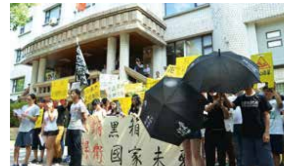
▲高中學生為「反高中課綱微調運動」走上街頭。

臺灣百年來的教育因政權更迭，面臨過幾次的變化，臺灣人在日治時期接受殖民教育成為「皇民」，戰後在國民黨政府的威權體制下被灌輸為「國民」，隨著臺灣主體意識的抬頭，臺灣人逐漸重視教科書內容對於學子的影響，教科書不再只是考試和分數，而是成為人人關心的「公民」議題。