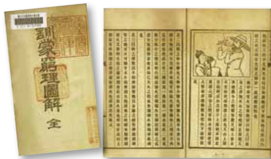
▲ 1900年總督府學務課編漢文讀本《訓蒙窮理圖解》書名頁及內頁。