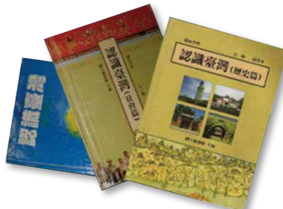
▲《認識臺灣》教材，首次將臺灣史地整合成單一課程。

至為此編寫《認識臺灣國中教科書參考文件》，批評《認識臺灣》教材涉及「臺灣意識」及「日本皇民史觀」。