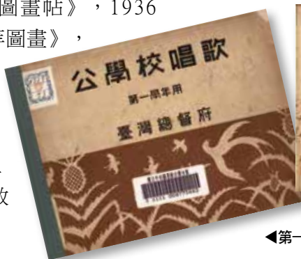
◀第一學年用《公學校唱歌》。

（全1冊），公學校的唱歌科才有第一本教科書，館藏存有一冊。《公學校唱歌集》收錄一至六學年所用教材歌曲共46首，分量輕少，且在序言說明，為配合「國語」讀本的進行，教師可視情況授課，未必完全按照本教科書之順序。1934年至1935年之間，總督府再度發行唱歌科教科書《公學校唱歌》，此時已將適用於六個學年的唱歌教材分開編纂，本館保存了1936年出版之第一、三、四學年的教科書。若欲了解唱歌科實施情形的讀者，還可參考館藏中《公學校唱歌科教授細目》、正榕會出版《標準唱歌學習帖》，以及《唱歌教材集》等相關教材或教師用讀物。☞