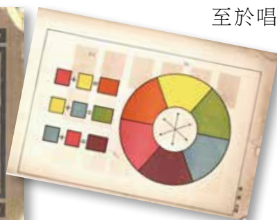
▲《公學校圖畫帖》內頁。

看完本期對各科公學校教科書的介紹，是否意猶未盡呢？接續本期主題，本文將介紹館藏中的公學校圖畫科教科書《公學校圖畫帖》，以及公學校唱歌科教科書《公學校唱歌》。