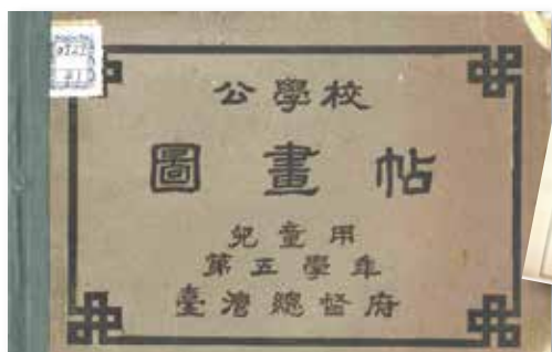
▲第五學年用《公學校圖畫帖》。