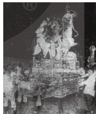
▲《臺灣日日新報》刊載城隍祭的詩意閣。

另一種則是關注藝閣競妍比美的競賽。藝閣雖然是祭典中的一環，但是性質上也是一種表演，每年媽祖祭或城隍祭時，各地往往舉辦競賽，由地方人士投票選出排名頒予獎勵，因此相關報導極多。這類報導中，1921年嘉義城隍祭的比賽結果報導〈藝閣月旦〉極具代表性，「西市魚商。裝通天河收金鯉魚。恰合本業。藝臺花樣翻新。鯉魚屹立大士頂上。暗藏機軸旋轉。……其次公孫娘舞