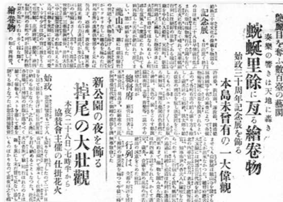
▲《臺灣日日新報》上「始政三十周年」紀念活動中數百臺藝閣麗奪目的報導。

果報導〈藝閣月旦〉極具代表性，「西市魚商。裝通天河收金鯉魚。恰合本業。藝臺花樣翻新。鯉魚屹立大士頂上。暗藏機軸旋轉。……其次公孫娘舞