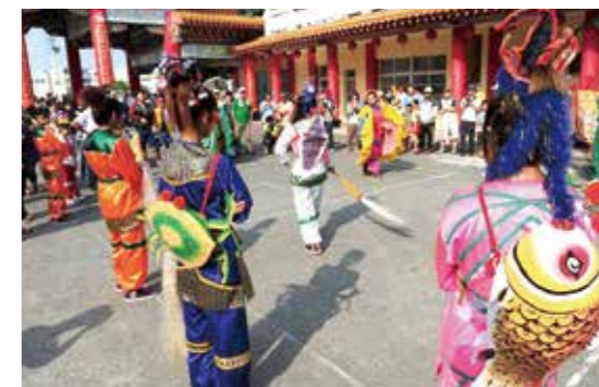
▲臺南西港香水族陣。

香陣原為一般參加進香隊伍陣頭的通稱。在進香的行列中，除了上述文、武、小戲、趣味、宗教等陣頭之外，尚有許多由信眾所組成的各式隊伍，如儀仗隊、繡旗隊、前鋒隊、報馬仔等，也是神明出巡遶境時壯盛陣容的必備陣勢，這類性質的隊伍可通稱為「香陣」。