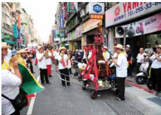
▲臺北靈安社北管組藝員參加霞海城隍遶境。

多，分類不易，傳統上活動力小的、多歌舞的就叫做「文陣」，如車鼓陣、牛犁陣等；活動力大的、有武打味道的便稱為「武陣」，如宋江陣、八家將等。