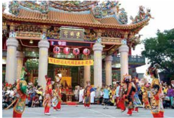
▲陣頭是廟會綵街活動中不可或缺的陣容。圖為屏東東港迎王家將團。