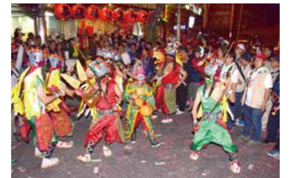
▲「迎青山王」是艋舺一年一度的盛會。圖為青山王暗訪夜巡，陣頭齊聚較勁。

在陣頭藝術的類型方面，吳騰達認為可按照其體裁、形式分為「樂舞」與「歌舞小戲」兩種類型；按其屬性則可分為「雜技類陣頭」與「小戲類陣頭」，前者有獅陣、龍陣、宋江陣、高蹺陣、跳鼓陣、布馬陣、鬥牛陣、十二婆姐陣、八家將等；後者有車鼓陣、牛犁陣。黃文博主張「藝陣」區分為「藝閣」與「陣頭」兩大類型，而又將陣頭區分為「宗教陣頭」、「小戲陣頭」、「音樂陣頭」、「香陣陣頭」、「趣味陣頭」與「喪葬陣頭」等六類。不過他也認為，陣頭的名目