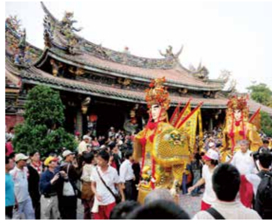
▲臺北保安宮遶境神將。

在臺灣各類型的廟會活動中，為了呈現出節慶的熱鬧氣氛以獲致娛神娛人的目的，除了安排各種戲曲的搬演外，最受矚目的便是各類型的陣頭活動。迎神賽會中陣頭組成的目的，最早即是為了護衛神駕、進行清道與壯盛行列排場，其形式即是模仿古代帝王、官吏出巡的隊伍而來。這些陣頭活動雖然並非廟會的核心，卻構成一般人對於廟會的主要印象，也是民眾「看熱鬧」的主要對象。