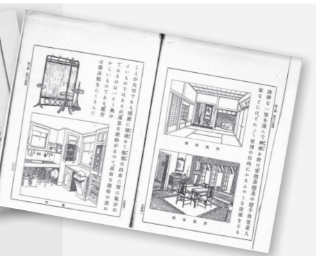
▲圖4 《公學校高等科家事書》第一學年用 第10課「室内的設備」。（玉川大學教育博物館所藏）

（廚餘、糞尿、塵埃……）的處理等。從這些內容可窺見，臺灣總督府想要透過教育改善臺灣人居住環境（圖4）。其他還有病人照護、育兒、經濟相關等內容也包含在家事科教材中，這些都是根據前文所提到的臺灣公立公學校規則第三十四條的內容。此外，在教授對於災害（竊盜、地震、火災、水災）的應變措施的課程中，也提及空襲時等緊急狀況的應對方法。而在年度活動的課程裡，則教授日本的年度活動，使其普及於臺灣人的家庭，作為貫徹皇民化政策的一環。