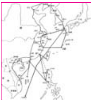
▲18 世紀中期，東亞海域難民返國路線示意圖

）派出官吏調查遭難原委，並檢查船貨中有無違禁貨物，然後安置館舍，支給衣物、口糧，接著再由州縣層層上報。原則上難民們都會被送往省城所在地，再經總督、巡撫上奏朝廷，經朝廷指示後再送至該當的港口或北京，附使節（船）或商船歸國。如琉球難民是送到福州，等琉球朝貢船來後，再附搭回國。朝鮮難民則由陸路先送至北京，安插會同館，