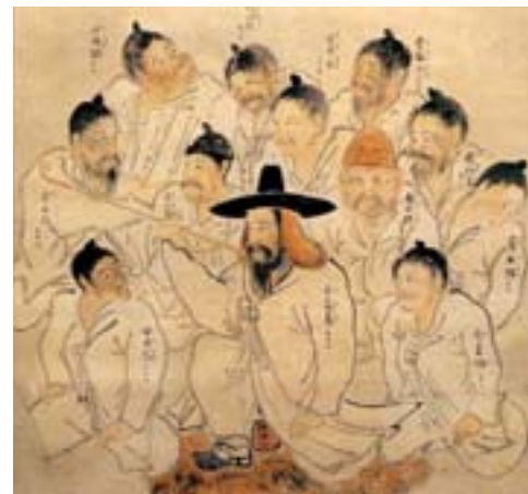
▲1819 年，漂流到日本鳥取藩的朝鮮難民圖。（部分，日本鳥取縣立圖書館藏）

臺灣在 1885 年建省前是屬於福建省管轄，因此，護送外國難民返國時，均須先送到省城福