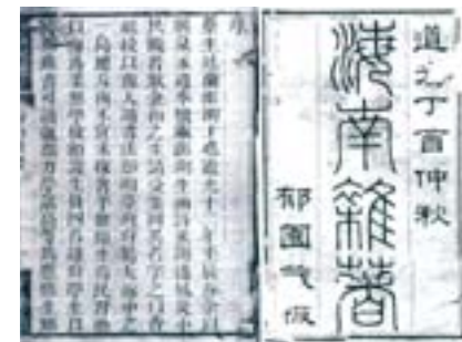
▲蔡廷蘭，《海南雜著》。（1837 年刊本，北京：國家圖書館藏）

屬例外；在東南亞各地，若當地官方無法提供援助時，華人網絡往往取代官方，不僅提供生活物資，若無官方（如朝貢船等）管道送還，華人貿易船（或西洋船）也發揮重要的功能，將日本、朝鮮、琉球等國難民經由中國送返本國。同樣的，中國船遭風漂到外國時，也是透過同樣方式返回自己家鄉。1835 年，澎湖人蔡廷蘭自福建搭船返臺時，途中遭風漂流至越南。經越南官員救助護送，翌年由陸路經兩廣回到故鄉澎湖。返鄉後，蔡廷蘭將遭難經過及在越南所見所聞撰成《海南雜著》一書，留下了珍貴的漂流紀錄。