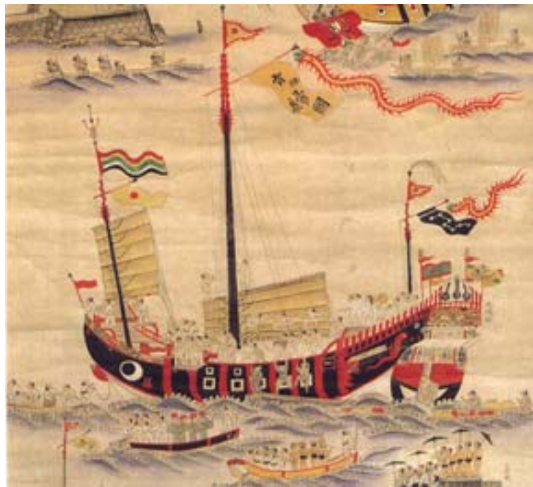
▲琉球進貢船圖。（部分，日本沖繩縣立圖書館藏）

臺灣四面環海，中隔臺灣海峽與大陸相望，黑潮、親潮流經臺灣島東西岸，加上冬季的東北季風、夏季的颱風，以及周遭多暗礁等因素，海象複雜。但因地當環中國海域南北往來之要衝，船隻往來頻繁，自古以來就是海難多發之地。連橫在《臺灣通史》卷十九，郵傳志中即云：「臺灣為南海之邦，而東西洋交通之道也。船舶往來，以是為的。然而礁石隱現，風濤澎湃，稍一不慎，舟輒破碎。」