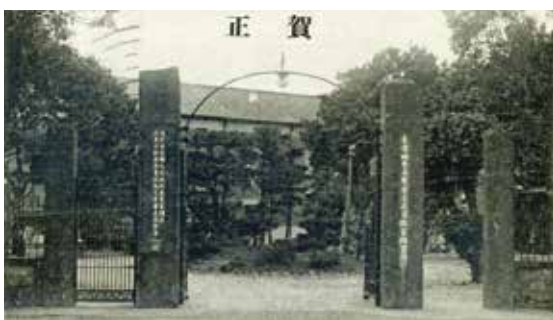
▲臺灣總督府警察官及司獄官練習所正門。

1898年臺灣總督府成立「臺灣總督府警察官及司獄官練習所」（下稱練習所），警察官部分作甲、乙兩科，甲科是警部練習生，是臺灣警界的幹部搖籃，乙科是巡查練習生，目標在培養基層巡查。中央研究院臺灣史研究所典藏的吉岡喜三郎文書，主人翁即是練習所體系所培養出的警務人才，從基層巡查一路做到警部，殖民地臺灣提供平民出身的吉岡一條晉升之路。