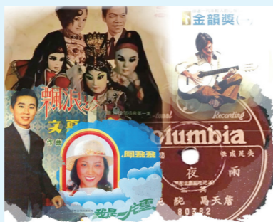
▲臺灣流行歌曲的唱片合成圖。

其實，六十年代的國語歌曲中亦有許多翻唱自日本的歌曲，相對於臺語歌曲承襲了轉音唱腔，國語歌曲則幾乎予以省略