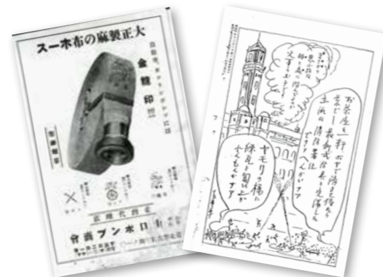
▲《臺灣消防》上的消防水帶廣告。

但是很可惜的，從其「編輯餘話」來看，《臺灣消防》經常面臨稿件不足的窘境；加上出版經費捉襟見肘，初期常有休刊的情形，也屢屢有主題不限、「投稿歡迎」的呼籲文章。直到 1936 年，該刊的稿源才算進入穩定的階段。另外，「地方通信」、「地方情報」專欄，是由各地支部的通信委員協助整理，並傳送日本各縣及