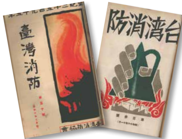
▲《臺灣消防》第 50 號、《台灣消防》第 103 號。

我們都知道，消防體系的建立很重要，消防觀念的養成與推廣同樣不可忽視，消防類書籍刊物的發行目的之一，就是為了傳布消防知識。