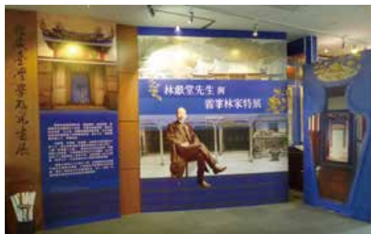
▲林獻堂先生與霧峯林家特展展至 12 月 27 日。

本次展覽六樓展場展出臺中市文化推廣協會郭双富理事長大方出借之多幅歷史照片，以及一新會徽章、萊園中學畢業證書、彰化銀行特刊等得一見的珍藏文物，搭配本館相關館藏、紀錄片，共同展出至 12 月 27 日，機會難得，歡迎讀者來館參觀，共同認識臺灣大族霧峯林家，回味百餘年來的臺灣史風華。☞