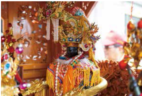
▲進安宮開基媽祖，相傳為蔡牽帶來，後逐漸發展成北方澳信仰中心。

海盜在地方上也留下歷史痕跡，例如南方澳進安宮之沿革即提到，其媽祖為蔡牽帶來之神像，最初供奉於北方澳的石洞中，後逐漸發展成為北方澳信仰中心；另外，在南方澳也有一處名為賊仔澳的地方，相傳曾為海盜停泊之地。