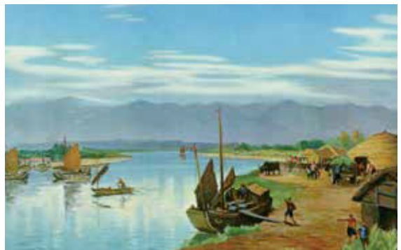
▲十七世紀，漢人在臺南附近溪畔從事糖作情形。（繪圖／小早川篤四郎）

1662 年 6 月 20 日（永曆 16 年 5 月初 8）鄭成功病歿，歷經波折，最終仍由鄭經繼承。1664 年鄭經退守臺灣，「分配諸鎮荒地，寓兵於農。又在承天府起蓋房屋，安插諸宗室暨鄉紳等。」其後，「改東都為東寧，天興、萬年二縣為州。」（《臺灣外記》）展開穩定統治的短暫時光。☞