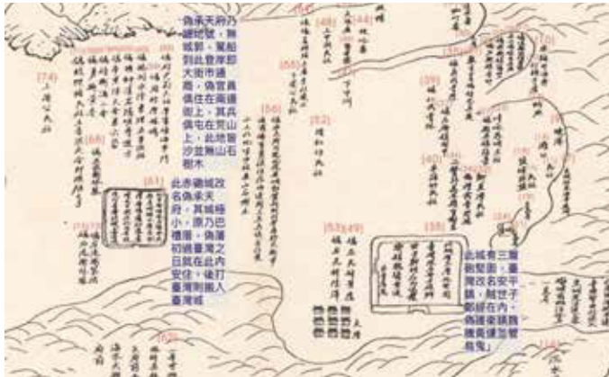
▲〈永曆 18 年臺灣軍備圖〉中的赤崁城與臺灣城。

落屯墾；每個將官手下軍隊約 1,000 人到 1,200 人，以 100 人到 120 人為一組，開墾土地。」