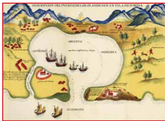
▲ 1626年〈福爾摩沙荷蘭人港口描述圖〉。從北線尾、熱蘭遮城位置推估，海尾應在船隻停泊處。

「丙午日大捷」敘說南澳總兵藍廷珍在1721年7月10日黎明，率領四百多艘戰船，與朱一貴守軍蘇天威展開砲戰，奪回鹿耳門砲臺的臺江戰事，此時「海靈助順，潮水漲高八尺」，戰船開進鹿耳門，南攻安平。清初戰船大抵