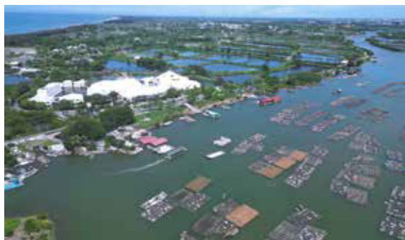
▲遠眺台江內海國家公園。

1970年以降海尾上千公頃魚塭遭工業廢水汙染。1992年民間發起保護黑面琵鷺，1994年爭取安順鹽田劃設「四草野生動物保護區」，2001年臺南市政府提出規劃國家公園。2002年起，安東庭園社區聯合各界，發起「台江文化運動」，捍衛臺灣歷史博物館留在安南區；《小台江》河流讀書會推動流域學習。2006年臺南社大台江分校發起大廟興學運動，「一村、一廟、一學堂」，培育積極公民；《小台江》並發起搶救