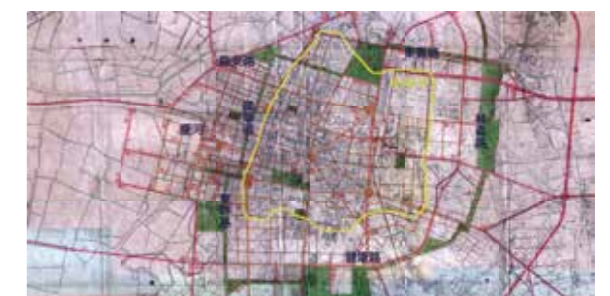
▲日治時期都市邊緣發展狀況圖。（圖片出處／「府城歷史街區（二期）計畫」，底圖引自「臺灣百年歷史地圖網」）

城牆拆除後，都市發展腹地逐漸向外擴張，許多公共建設選擇興建在有較大腹地的都市邊緣區域。除北側維持原有軍事機能，城牆周邊地區的機能多逐漸轉變，東側、南側以教育、研究、體育設施為主；西側延續市中心商業及貿易運輸機能；西南側是商業需求所延伸出的娛樂街區，包括既有的刑務所及墓地，類似現在鄰避設施性質的發展。