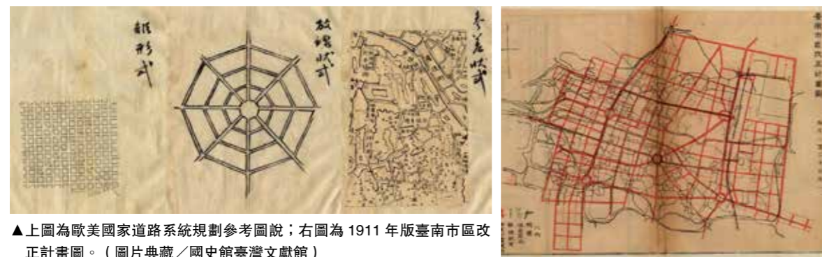
▲上圖為歐美國家道路系統規劃參考圖說；右圖為1911年版臺南市區改正計畫圖。

臺南市區計畫委員會設立於1899年，曾向臺灣總督府諮詢，取得包括雛型式（棋盤附對角線）、放線狀式、參差狀式等三種類型的歐美國家道路系統