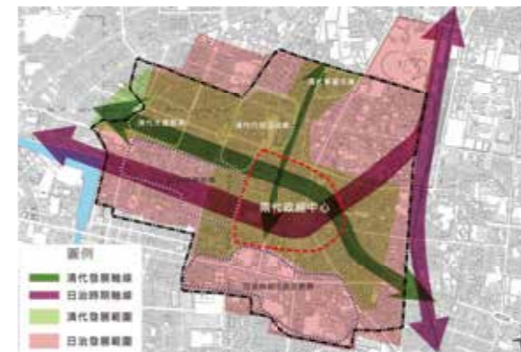
▲清國及日本統治時期府城發展分區圖。

規劃參考圖說，而後以局部的道路改修或拓寬工程來改善環境（包括陸續拆除城牆），並進行相關調查與討論。直到1911年初次發布「臺南市街市區計畫及其地域決定」，臺南市區主要道路結構與圓環正式出現在計畫圖中。