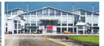
▲民航的花蓮航空站。