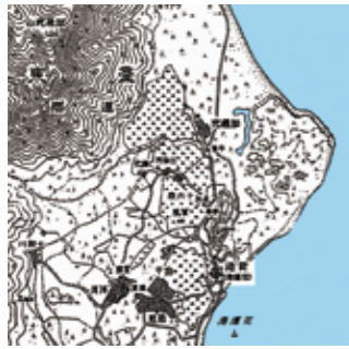
▲於1905年左右出版的十萬分之一臺灣圖上，加禮宛一帶可見七星潭的形狀與位置。