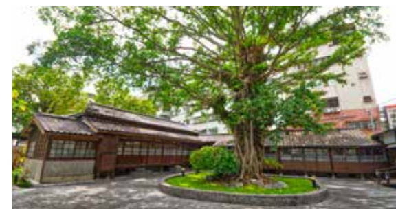
▲臺灣銀行礁溪訓練中心，前身為西山旅館。