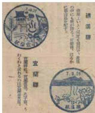
▲宜蘭驛、礁溪驛戳章及設計元素。

宜蘭線鐵道開通至今滿百年，改善臺北宜蘭間原本不便的交通，為宜蘭地區觀光發展提供必要條件，強化相關溫泉遊憩地景之建構。有些地景依然可見，員山溫泉約位於今力麗威斯汀度假酒店所在範圍；見證礁溪溫泉開發歷程的西山旅館，2002年由宜蘭縣政府登錄為歷史建築；湯圍溫泉溝也在2005年指定為歷史建築，泡湯池持續供民眾使用。這些歷史地景已融入庶民生活日常，承載社會集體記憶，更是當代重要的觀光資源與文化資產。