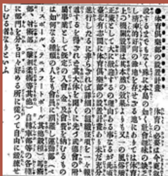
《臺灣日日新報》報導體育俱樂部設置計畫 臺灣日日新報社，《臺灣日日新報》1902年11月26日、日刊2版