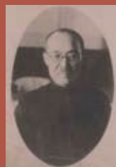
臺灣山岳會首任會長幣原坦

原幹次郎，《皇太子殿下御誕生奉祝臺灣記念寫真帖》（臺北：勤勞と富源社，1934年12月）