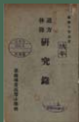
《讀方体操研究錄》內容為體操教學，有明確的指導教案