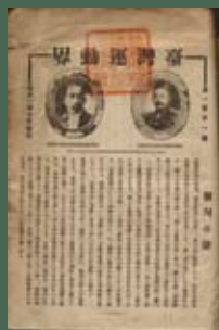
《臺灣運動界》創刊號

體育雜誌可分為一般性雜誌和專門性雜誌。前者概有《臺灣運動界》、《運動と趣味》、《臺灣スポーツ》等，後者則有《臺灣野球界》、《T·G·C》、《臺灣山岳》等。