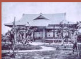
武德會為大日本武德會推廣日本武術的據點，圖為臺東武德會東武館

原幹次郎，《皇太子殿下御誕生奉祝臺灣記念寫真帖》（臺北：勤勞と富源社，1934年12月）