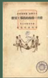
《體育の特殊的指導と實際》內容著重體操和遊戲教學