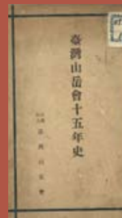
《臺灣山岳會十五年史》

臺灣高爾夫俱樂部於1919年設立，採會員制，推廣高爾夫球運動。臺灣山岳會成立於1926年，以普及登山知識、推廣登山活動為宗旨。此外，尚有臺灣曲棍球俱樂部（ホッケークラブ）、臺灣足球聯盟（臺灣蹴球聯盟）等團體。