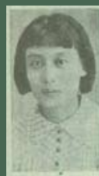
林月雲 臺灣新民報社調查部，《臺灣人土鑑》（臺北：臺灣新民報社，1934年）

林月雲，1915年生於彰化和美，畢業於彰化高等女學校，在學期間展現優異的田徑才能。1931年，代表臺灣參加明治神宮體育大會，成為首位參加該會的臺灣女運動員，1933年，入學日本女子體育專門學校，翌年再奪得日本陸上競技選手權大會三級跳遠冠軍，1936年獲選為奧運培訓選手。戰後投入田徑運動教學，是臺灣知名的女子田徑運動員。