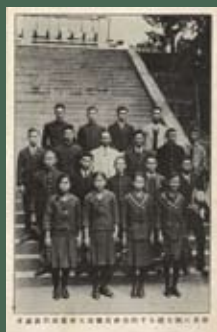
1928年參加明治神宮體育大會的選手們，柳金木也在其中