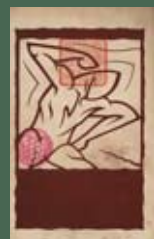
《創立十周年臺灣體育史》運動員插圖

臺北市樟山尋常小學校體育研究部，《臺灣に於ける小學校體育の實際》(臺北：臺灣子供世界社，1924年)