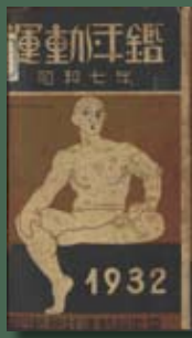
《運動年鑑》介紹日本及其勢力範圍內各地的體育記事