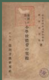
《臺灣に於ける小學校體育の實際》介紹小學校體育課程，內容以體操和遊戲為主

體育書籍以《創立十周年臺灣體育史》最為重要，介紹日治時期臺灣體育沿革之發展，專書則有《臺灣ゴルフ俱樂部二十年史》、《臺灣野球史》等，此外，學校亦出版不少相關的教學參考書。