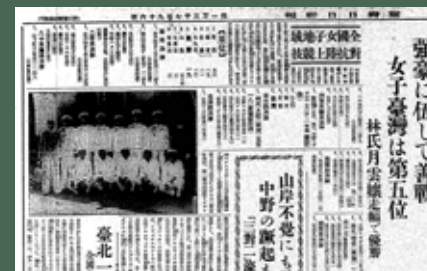
臺灣日日新報社，《臺灣日日新報》，1938年8月16日，日刊8版