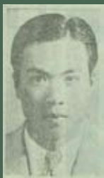
張星賢 臺灣新民報社調查部，《臺灣人土鑑》（臺北：臺灣新民報社，1934年）

張星賢，1910年生於臺中龍井，1930年自臺中商業學校畢業後，1931年入學早稻田大學，在學期間即在多次比賽中締造多項田徑項目紀錄。曾兩度獲選日本代表隊，參加1932年洛杉磯奧運和1936年柏林奧運，以及1934年遠東運動會（極東オリンピック）等國際體育賽會，是第一位參加奧運的臺灣人運動員。