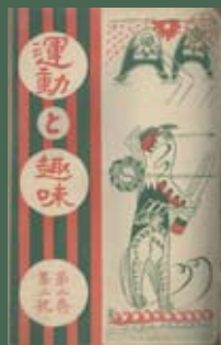
《運動と趣味》第2卷第2期

伊藤孟三部，《臺灣運動界》第1卷第1號 (臺北：臺灣體育獎勵會，1915年10月)