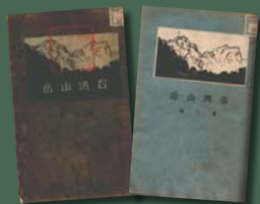
《臺灣山岳》創刊號、第2號

《臺灣野球界》創刊於1917年，係以棒球運動為主的雜誌。《T·G·C》為臺北高爾夫俱樂部之機關雜誌，發刊於1931年。其他專門性雜誌尚有賽馬雜誌《竹馬時代》、登山雜誌《臺灣山岳》、武術《日本武德會臺灣支部 劍道同志會會誌》等。