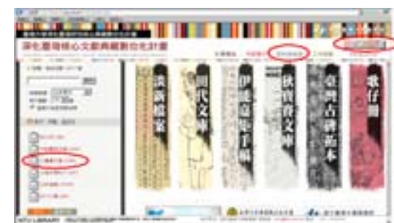
▲狄寶賽文庫資料庫。（網址： http://dtrap.lib.ntu.edu.tw/DTRAP/index.htm ），受智財權之限的資料影像須至臺大圖書館5F特藏組使用。

美援臺灣與狄寶賽先生 (DVD) = Valery S. de Beausset and U.S. Aid to Taiwan / 光啟社承製，國立臺灣大學圖書館監製發行。臺北市：國立臺灣大學圖書館