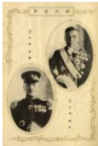
▲第13任臺灣總督石塚英藏、第14任臺灣總督太田政弘，都是由關東廳長官調任來臺。

自1905年日本在遼東半島設關東總督府（後屢有改變其名稱與職權），迄滿洲國建立後，臺灣總督府與滿洲有何關係？1904年日俄戰爭爆發，臺灣總督兒玉源太郎任滿洲軍總參謀長，在他運籌