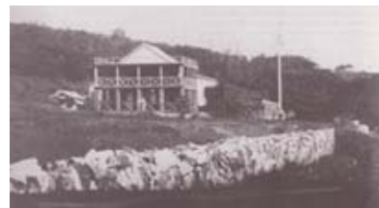
▲杜德在淡水的住宅。

臺灣開港後，首任英國副領事郇和（Robert Swinhoe）抵達淡水，發現臺灣早有相當數量的茶運銷大陸，他在報告中指出：北臺灣因氣候適合，且有兩三個港口靠