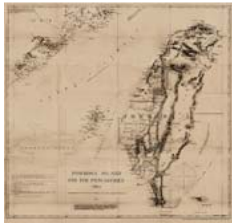
▲李仙得於 1870 年繪製的「福爾摩沙島與澎湖群島」地圖。

Charles William LeGendre（1830 - 1899），中文名李仙得，或李讓禮、李善得，出身法國東部，畢業於巴黎大學。1854 年與一名美國女性結婚後，即歸化為美籍，定居美國；曾參與 1861 - 1865 年的美國南北戰爭，為北軍屢建軍功，但也失去了左眼；1864 年 10 月退役，次年 3 月獲頒陸軍准將殊榮。