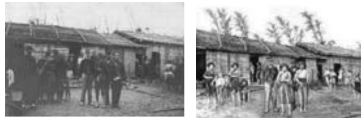
▲李仙得與射麻里居民。左圖為原始照片，右圖為模擬畫作。

在李仙得的種種紀錄中，或許以 1867 年在必麒麟（W. A. Pickering）等人陪同下，到臺灣南端琅嶠十八社與頭目卓杞篤