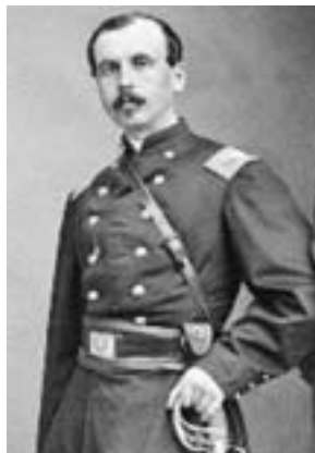
▲李仙得。（圖片引用自紐約州 Morrisville State College 圖書館建置美國內戰與地方史網站）