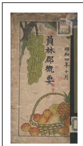
圖 2：《員林郡概要》封面