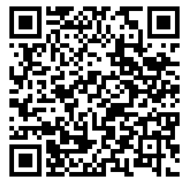
▲圖書醫院紙上展覽，詳情請掃描 QR。